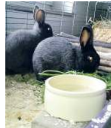
Die geretteten Tiere können im Peiner Tierheim besucht werden.

Öffnungszeiten: Montag, Dienstag, Freitag, 15 bis 17 Uhr, Samstag, Sonntag, 11 bis 13 Uhr, Mittwoch, Donnerstag und Feiertag geschlossen.