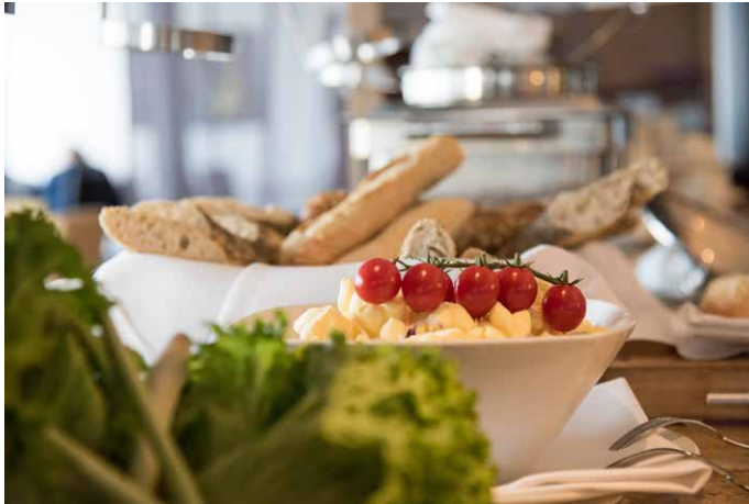
Nach der gemeinsamen Stärkung in der Gast- stätte „Grünes Herz“ ...