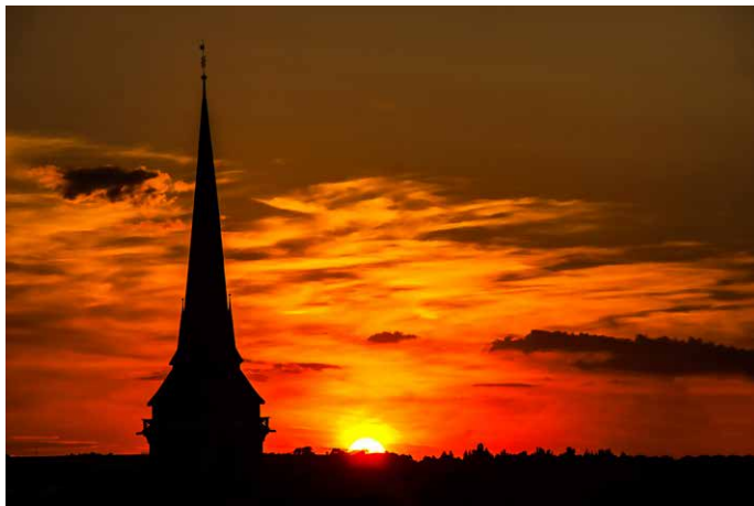
... endete der erste Veranstaltungstag mit einer Nachtwächter- führung durch Erfurts Altstadt.