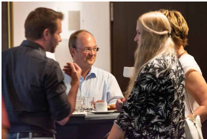
... auch in den Pausen.