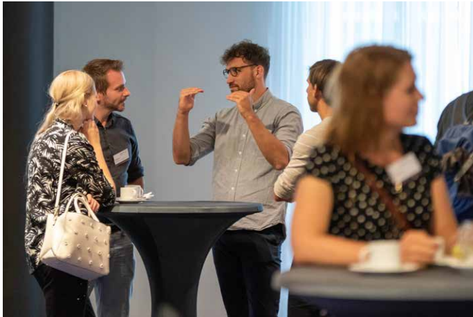
Netzwerken und Diskutieren ...