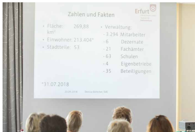
... die „Faire Beschaffung in der Landeshauptstadt Erfurt“ vor.