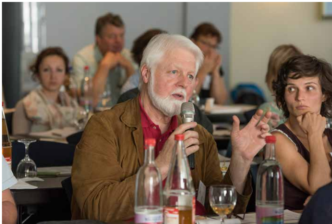
Alle Vorträge waren geprägt durch viel Interaktion mit den Zuhörern.