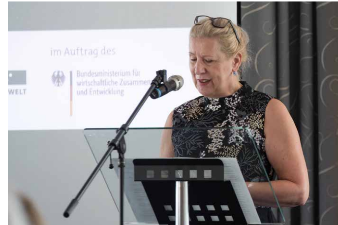
... hielt die Begrüßungsrede.