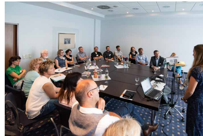
... verschiedene Schulungs- und Unter- stützungsangebote zur Umsetzung einer Fairen Beschaffung näher.