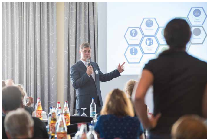
... über die strukturelle Verankerung einer nachhaltigen Beschaffung in der Kommune.