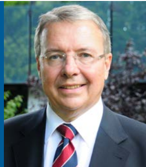
Frithjof Kühn © Rhein Sieg Kreis

von Frithjof Kühn, von 1999 bis 2014 Landrat des Rhein-Sieg-Kreises