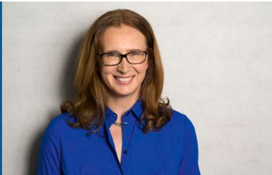
Gisela Stang

von Gisela Stang, von 2001 bis 2019 Bürgermeisterin der Stadt Hofheim am Taunus