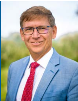
Stefan Rößle © Gregor Wiebe

Interview mit Stefan Rößle, seit 2002 Landrat des Donau-Ries-Kreises