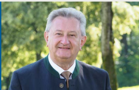
Franz Meyer

von Franz Meyer, von 2008 bis 2020 Landrat des Landkreises Passau, von 1990 bis 2008 Landtagsabgeordneter in Bayern und von 2003 bis 2007 Staatssekretär im bayerischen Finanzministerium