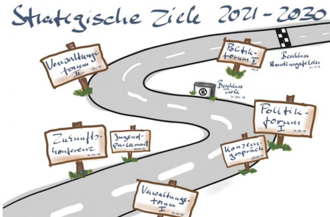
Überblick über die einzelnen Formate auf den Weg von der Diskussion zu den strategischen Zielen.

Was wollen wir bis wann erreichen und woher wissen wir, dass wir am Ziel sind? Das sind grundlegende Fragen mit denen sich die Stadt Osnabrück seit mehreren Jahren intensiv auseinandersetzt. Mit den strategischen Zielen 2016 bis 2020 hat sie einen Handlungsrahmen geschaffen, um Osnabrück noch lebens- und lebenswerter zu gestalten. Diesen Weg galt es weiterzugehen und strategische Ziele für den Betrachtungsraum 2021 bis 2030 zu definieren.