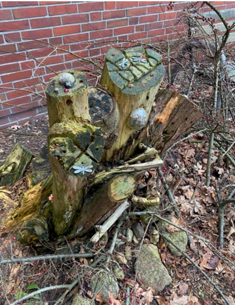
Abbildung 2: Ein von den Kindern der Kita Sellstedt in ein Insektenhotel umfunktionierter Baumstumpf. Nachhaltigkeite Nutzung vorhandener Ressourcen zur Förderung der Biodiversität

Gleichstellung der Geschlechter ein und versucht durch die Einbindung von Jugendbeteiligungen und dem Senioren-Beirat generationsübergreifender Gerechtigkeit nachzukommen.