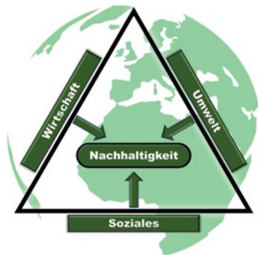
Abbildung 1: Dreieck der Nachhaltigkeit

Die Gemeinde Schiffdorf hat diese komplexen Herausforderungen für sich angenommen und daher beschlossen, den Fokus des Handelns zukünftig verstärkt auf nachhaltige Entwicklung zu legen und sich 2020 erfolgreich auf eine Teilnahme am Projekt „Global Nachhaltige Kommune Niedersachsen II“ beworben. Nach der Gründung einer administrativen Kernsteuerungsgruppe und einer operativen Projektsteuerungsgruppe wurde mit einer Bestandsanalyse begonnen. Dazu wurden zunächst verwaltungsintern laufende Vorhaben hinsichtlich nachhaltiger Ansätze untersucht. Dabei stellte sich heraus, dass die überwiegende Mehrheit der kommunalen Projekte bereits nachhaltige Eigenschaften aufwies. So galt es nun die bestehenden Konzepte unter dem oben beschriebenen Aspekt der