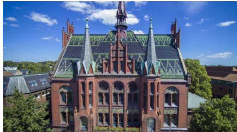
In Neumünster unterstützt ein Integriertes Stadtentwicklungskonzept die Stadtentwicklungsplanung.

Definiert wurden fünf übergeordnete Ziele: Neumünster als Oberzentrum erhalten und stärken; die Einwohnerzahl stabilisieren bzw. auf 80.000 bis 90.000 erhöhen; verschiedene Bevölkerungsgruppen und ihre besonderen Bedürfnisse berücksichtigen; Alleinstellungsmerkmale und ein besonderes Profil aufbauen und die (Innen-)Stadt attraktiver machen.