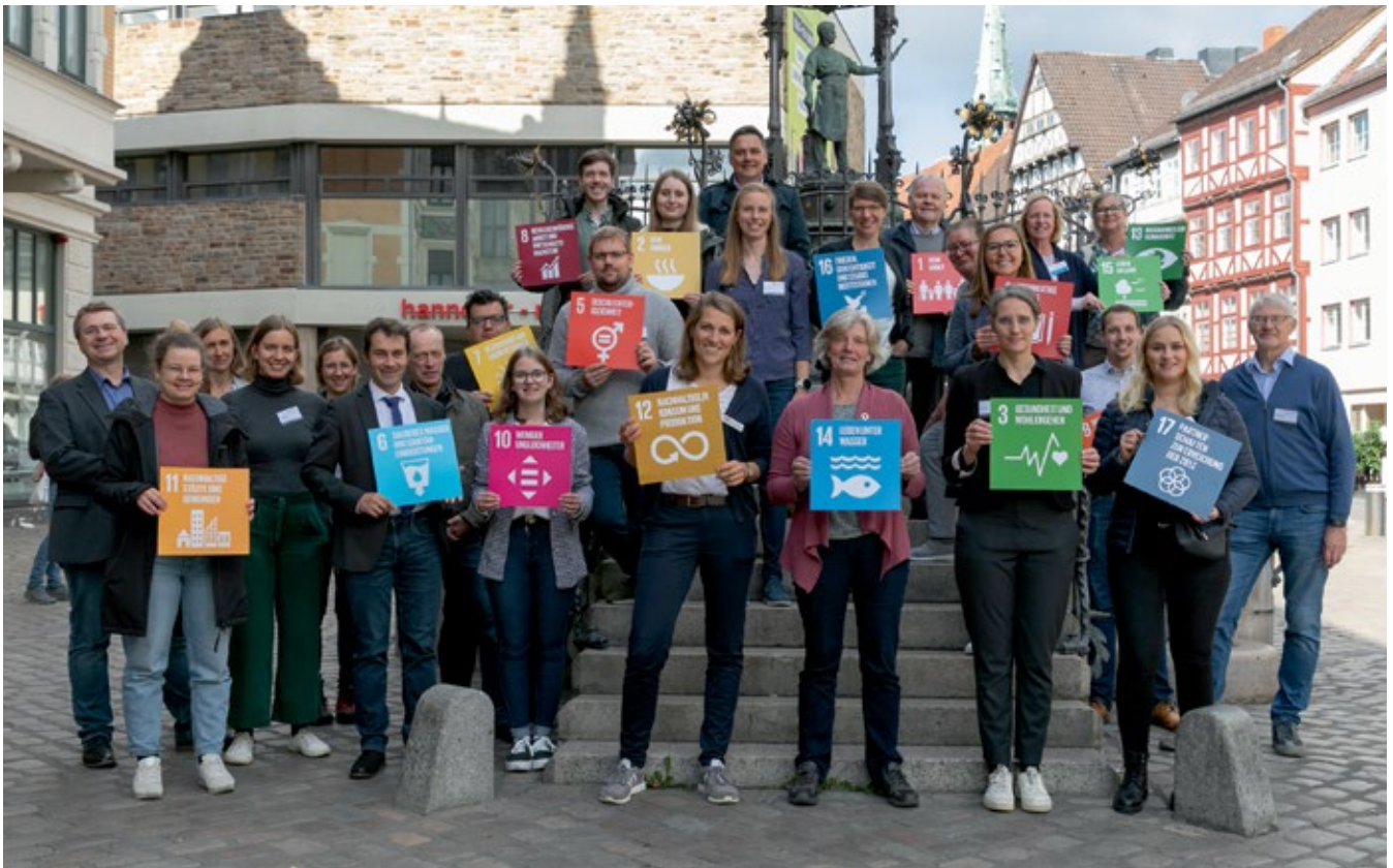
Teilnehmende vor dem Holzmarktbrunnen in Hannover.

So sind nun 27 Kommunen Teil des GNKN-Netzwerks Niedersachsen! Sie stellen einen Querschnitt der kommunalen Landschaft in Niedersachsen dar: Samtgemeinden, Mitgliedsgemeinden, Einheitsgemeinden, Groß-, Mittel- und Kleinstädte sowie Landkreise sind mit im Boot!