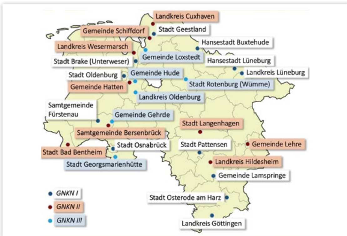
Teilnehmende Kommunen aus allen drei Runden GNK Niedersachsen

Das Projekt „Global Nachhaltige Kommune in Niedersachsen“ setzte hier an. In einer ersten Phase entwickelten 12 niedersächsische Gemeinden, Städte und Kreise von Ende 2018 bis Ende 2019 Strategien zur Verankerung und Umsetzung der globalen Nachhaltigkeitsziele. An deren Erfahrungen knüpfte die zweite Runde an, die von Ende 2020 bis Ende 2021 mit neun Kommunen umgesetzt wurde. Diese Runde war geprägt von der Corona-Pandemie, durch die ein persönlicher Austausch deutlich erschwert war. Der Zeitraum der dritten Runde war von Anfang 2022 bis Ende 2023 mit nun 16 Kommunen. Davon haben 10 Kommunen bereits in den vorangegangenen Phasen Handlungsprogramme erstellt, die zu einer Nachhaltigkeitsstrategie weiterentwickelt wurden. Sechs Kommunen waren neu im Projekt und befassten sich zunächst mit der Bestandsaufnahme, die Basis für die dann folgenden Handlungsprogramme war.