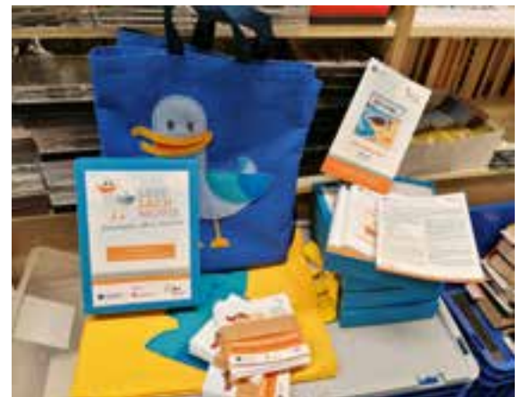
LeseLachmöwe - Ein Programm zur Leseförderung