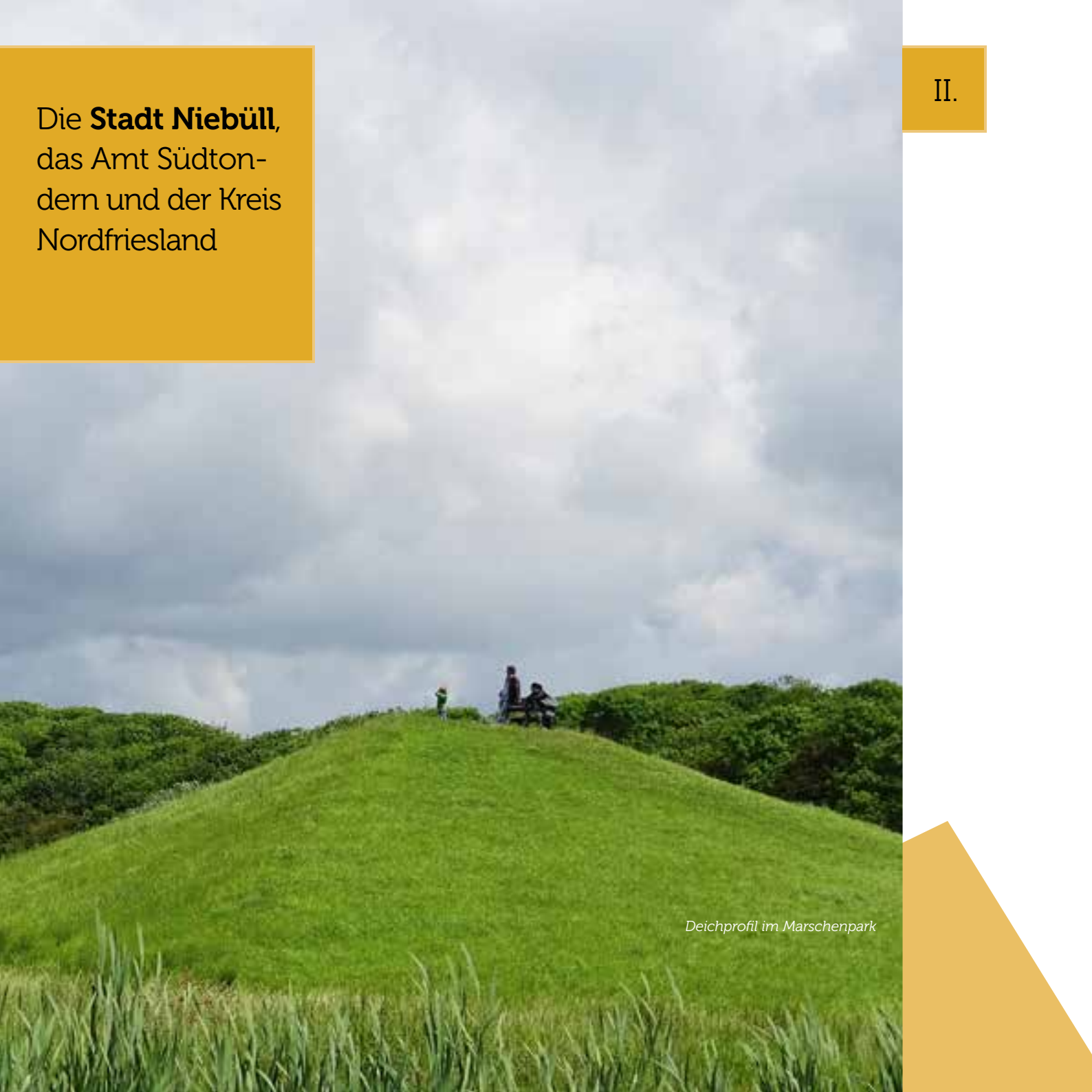
Deichprofil im Marschenpark