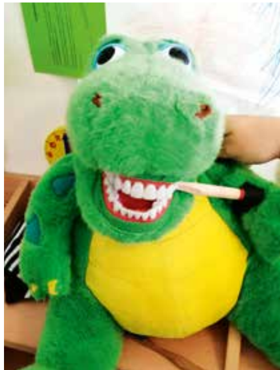
Nachhaltigkeit beginnt schon in der Kita - Zahnprophylaxe mit einer Bambuszahnbürste

Bei der Tafel ist man entsetzt, dass es Tafeln überhaupt geben muss und ein Missverhältnis in der Gesellschaft besteht: Auf der einen Seite existiert die Überproduktion mit immer vollen Regalen und den aussortierten Waren, die sonst im Müll landen würden; auf der anderen Seite gibt es die bedürftigen Menschen. Einer der wichtigsten Grundsätze der Tafelbewegung ist daher auch das Retten von Nahrungsmitteln.