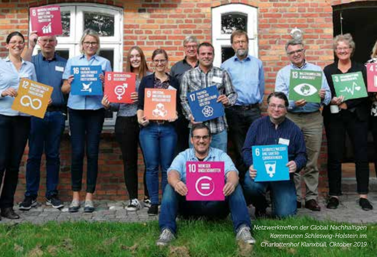
Netzwerktreffen der Global Nachhaltigen Kommunen Schleswig-Holstein im Charlottenhof Klanxbüll, Oktober 2019