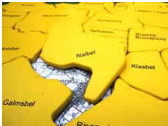
Gemeindepuzzle der AktivRegion Nordfriesland Nord

Dieses Signal hat auch Niebüll als nördlichste Zeichnungskommune Deutschlands Ende Dezember 2018 gesetzt. In der Stadt versteht man die Musterresolution als Selbstverpflichtung sowie als Signal an die Einwohner*innen, dass Niebüll ihren politischen und kommunalen Pflichtaufgaben im Bewusstsein nachhaltigen Agierens nachkommt und Akteurin für die Umsetzung der Agenda 2030 vor Ort ist. Es gilt nun, die bisherigen Erkenntnisse und Erfahrungen zu nutzen, darauf aufzubauen, Neues mit Altem zu verknüpfen und nachhaltige Entwicklung zu einer der dringlichsten Aufgaben zu erklären.