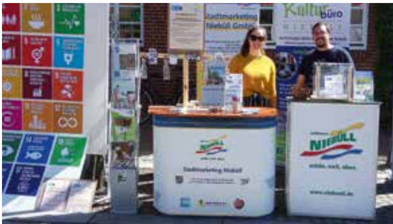
Infostand zu den 17 globalen Nachhaltigkeitszielen (SDGs) beim Niebüller Hauptstraßenvergnügen

Im Folgenden sind einige Beispiele skizziert, wie die zukünftigen Aktivitäten der Stadt Niebüll zur weiteren Umsetzung der Nachhaltigkeitsziele beitragen: