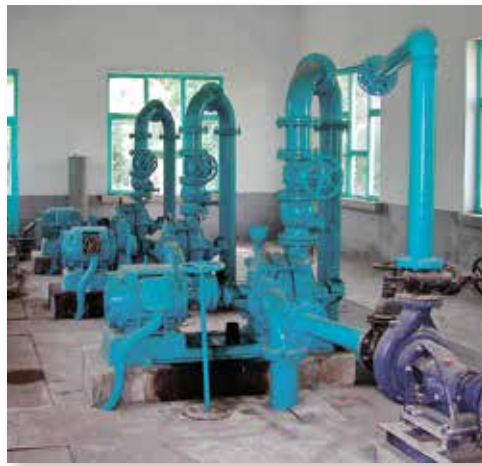
Eine Pumpstation mit deutscher Technologie aus den 1970er-Jahren ist zum Teil noch erhalten

von Afghaninnen und Afghanen nichts anderes als ein Leben unter Ausnahmebedingungen hinter sich haben.