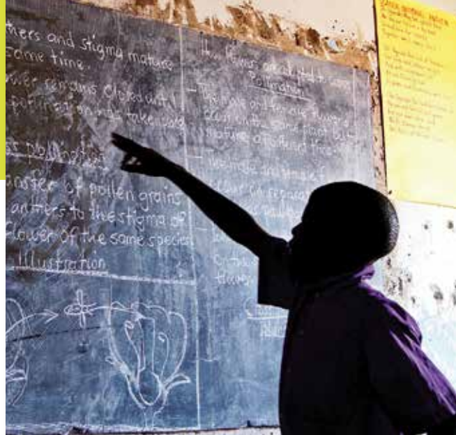
Bildung trägt maßgeblich zur Überwindung von Hunger und Armut in Entwicklungsländern bei, weil es die Zukunftschancen junger Menschen fördert

Viele Aktivitäten der entwicklungspolitischen Bildungs- und Öffentlichkeitsarbeit im Inland werden von Partnerschaftsvereinen, anderen gemeinnützigen Organisationen und Schulen getragen. Sie haben die Möglichkeit, über das „Förderprogramm Entwicklungspolitische Bildung“ (FEB) von Engagement Global einen Antrag auf eine 75-prozentige Förderung von Bildungspro-