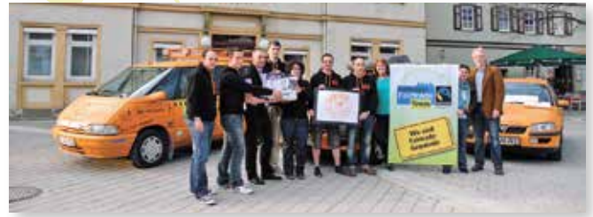
Die Fairtrade-Gemeinde Aidlingen machte auf sich und die Ziele des Fairen Handels aufmerksam, indem sie 2013 das Gewinnerteam der Rallye Allgäu-Orient unterstützte