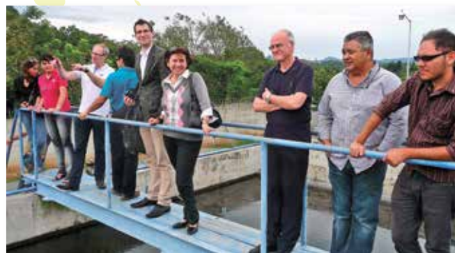
Wie die dezentralen Kläranlagen in Alajuela funktionieren, wird direkt vor Ort erkundet

Des Weiteren nehmen beide Kommunen an dem Programm ASA-Kommunal SüdNord 2016 teil. Mit diesem Austauschprogramm für junge Menschen gibt es für mehrere Monate eine