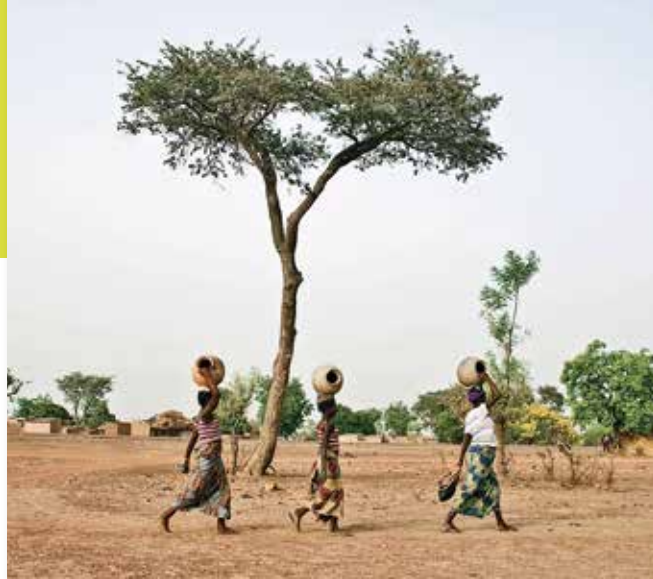
Burkina Faso, was übersetzt Land des aufrichtigen Menschen heißt, gehört immer noch zu den ärmsten Ländern der Welt

Wie gezeigt, liegt ein besonderer Schwerpunkt auf der Hilfe für die westafrikanische Partnergemeinde Piéla, die 2007 zum Stand der Millenniums-Entwicklungsziele befragt wurde. Hinsicht-