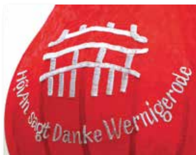
Die erste deutsch-vietnamesische Städtepartnerschaft besteht seit Juli 2013 zwischen Wernigerode und Hoi An

Dieser Trend ist in Vietnam noch nicht so stark wie in Deutschland; traditionelle Familiengemeinschaften sind in dem asiatischen Land noch deutlich häufiger zu finden. Doch zeichnet sich auch dort vor allem in den größeren Städten bereits ein Wandel ab, der in Zukunft zu Pflegeengpässen führen kann.