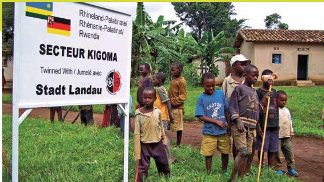
Im Rahmen der Partnerschaft des Landes Rheinland-Pfalz mit der Republik Ruanda pflegt Landau eine Städtepartnerschaft mit Ruhango/Kigoma