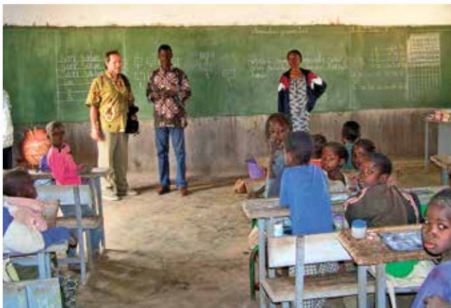
Dank des Partnerschaftsprojektes lernen die Kinder in Nouna Lesen und Schreiben