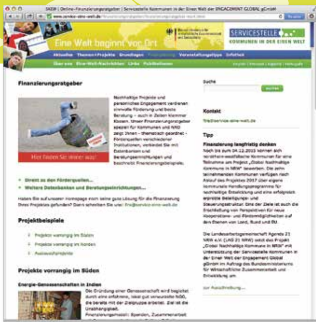
Zu allen Förderprogrammen und Stiftungen finden sich konkretere Informationen unter www.service-eine-welt.de/fira

löste die Stadt Leipzig beispielsweise, indem bei Städtepartnerschaften auf die Haushaltstellen für Dienstreisekosten und Honorarmittel zurückgegriffen werden konnte, um zumindest eine Teilfinanzierung zu gewährleisten.