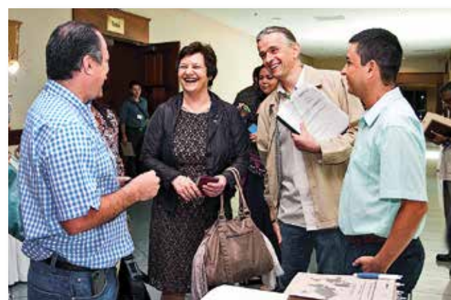
Im Rahmen des Projekts „50 Kommunale Klimapartnerschaften bis 2015“ entwickeln deutsche Städte mit Kommunen im Globalen Süden gemeinsam Handlungsprogramme in den Bereichen Klimaschutz und Klimaanpassung

Wie sehr deutsche Städte, Gemeinden und Landkreise ihrerseits durch diesen Erfahrungsaustausch gewinnen können, zeigt sich beispielsweise im Projekt „50 Kommunale Klimapartnerschaften bis 2015“ der Servicestelle Kommunen in der Einen Welt in Kooperation mit der Landesarbeitsgemeinschaft Agenda 21 NRW (LAG 21 NRW), das vom Deutschen Städte- und Gemeindebund seit Jahren unterstützt wird. Hier bringen sowohl deutsche als auch Kommunen der Süd-Partnerländer Expertise sehr unterschiedlicher Art mit. Beide Seiten können voneinander lernen und profitieren – unmittelbar durch Verbesserungen in ihrem lokalen Umfeld und mittelbar durch die gemeinsamen Beiträge zu globalem Klimaschutz und Klimaanpassung. Die kommunalen Klimapartnerschaften sind ein vielversprechender Ansatz, um ein globales Thema gemeinsam lokal anzugehen.