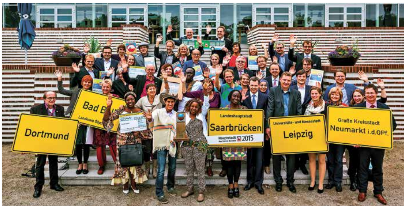
Das Engagement von Kommunen für Fairen Handel wird alle zwei Jahre im Rahmen des Wettbewerbs „Hauptstadt des Fairen Handels“ ausgezeichnet – zuletzt im September 2015

Kommunale Entwicklungspolitik bietet viele Chancen für deutsche Städte, Gemeinden und Landkreise. Wer von ihnen entwicklungspolitisch aktiv wird, kann nur gewinnen – in Deutschland und in der Einen Welt.