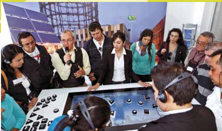
Im Bereich des Klimaschutzes können Kommunalexpertinnen und -experten aus Industrie- und Entwicklungsländern voneinander lernen

Entwicklung behandelt. In vielen Ländern des Globalen Südens stehen dabei insbesondere Klein- und Mittelstädte im Fokus, da in diesen zum Beispiel auf dem afrikanischen Kontinent in den nächsten Jahrzehnten ein hohes Bevölkerungswachstum zu erwarten ist. Zudem sind viele eher ländlich geprägte Kommunen besonders vom Klimawandel betroffen. Kleine und mittlere Kommunen im Norden und Süden teilen Charakteristika, wie zum Beispiel die hohe Bedeutung von Stadt-Umland-Beziehungen sowie die Notwendigkeit der Kooperation mit anderen Kommunen innerhalb der Region. Ein wechselseitiger Austausch von Praxiserfahrungen und guter Beispiele von Projekten bietet somit auf beiden Seiten Lernpotenziale.