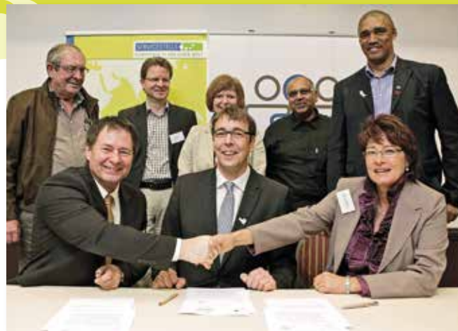
Die Stadtoberhäupter von Neumarkt und Drakenstein besiegelten ihre Projektpartnerschaft per Handschlag

Auch die Neumarkter Schulen sind im Klimaschutz sehr aktiv, zum Beispiel im Rahmen der Projekte „Prima Klima“, „Klimameilen“ oder „Biobrotboxaktion“.