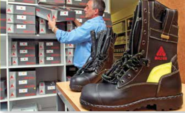
Immer mehr Kommunen setzen bei der Ausstattung ihrer Feuerwehren auf Berufskleidung, die unter Einhaltung der ILO-Kernarbeitsnormen produziert wird

bezogene oder soziale Aspekte“ berücksichtigen kann. Weiter heißt es etwa in § 16 Abs. 6 Nr. 3 S. 3 VOB/A, dass für die Zuschlagserteilung „der niedrigste Angebotspreis allein nicht entscheidend ist“.