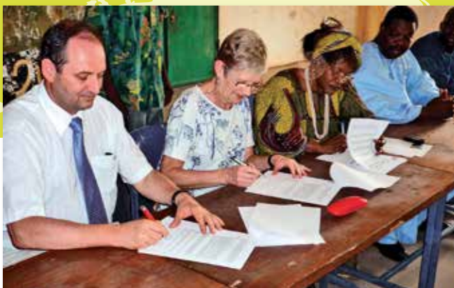
Am 12. Februar 2009 unterzeichneten die Bürgermeister der Dreieckspartnerschaft das Protokoll für eine dezentralisierte Kooperation zwischen den Städten Nouna, Saint-Priest und Mühlheim am Main