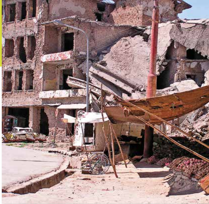
Der Alltag der Afghaninnen und Afghanen ist seit Jahren von Krieg und Zerstörung geprägt