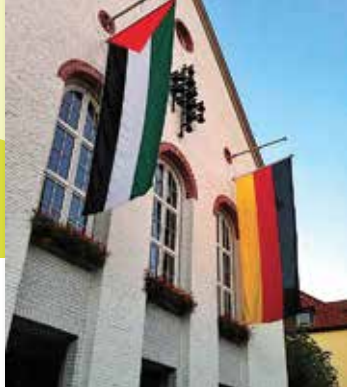
Am Xantener Rathaus wehte zur Begründung der Partnerschaft neben der deutschen auch die palästinensische Fahne

der großen Sperrmauer, die man zwar mit einem mulmigen Gefühl aber als Deutscher unproblematisch durchfährt, hat man niemals den Eindruck, unsicher oder in Gefahr zu sein.