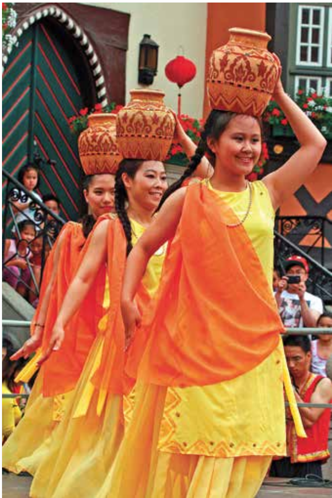
Gesangs- und Tanzgruppen präsentierten auf dem Lampionfest traditionelle vietnamesische Kultur

NRW (LAG 21 NRW) seit 2011 durchgeführt. Der Deutsche Städtetag, der Deutsche Städte- und Gemeindebund sowie der Deutsche Landkreistag unterstützen das Projekt. Ziel des Projekts ist es, die fachliche Zusammenarbeit Wernigerodes und Hoi An in den Bereichen Klimaschutz und Klimaanpassung zu stärken. Die Themen sollen dabei systematisch in die bestehende kommunale Partnerschaftsarbeit integriert werden. Dazu werden mit Unterstützung der Träger gemeinsame Handlungsprogramme entwickelt und die Umsetzung initiiert. Im Rahmen dieser fachlich begleiteten Partnerschaft ist es für die Partnerkommunen einfacher, Projekte zu entwickeln, Förderungen zu beantragen und den Austausch zu organisieren. Ein konkreter Bedarf in Hoi An ist die Umstellung auf erneuerbare Energien im Hinblick auf die Nachtbeleuchtung von traditionellen dekorativen Hoi An-Seidenlampions und zur Beschallung mit klassischer Musik in der als Weltkulturerbe anerkannten Altstadt Hoi An. Hierzu werden wir in den nächsten Wochen einen konkreten Projektantrag erarbeiten und zur Förderung einreichen.