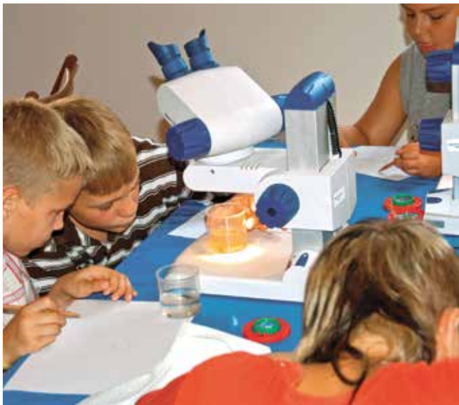
Kinder untersuchen Wasserproben im „Grünen Klassenzimmer“, einem offiziellen Projekt der UN-Dekade „Bildung für nachhaltige Entwicklung“ in Bad Rappenau