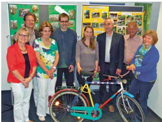
Im Rahmen des städtischen Förderprogramms „Nachhaltigkeit neu lernen“ beteiligen sich Akteure in Neumarkt an der Gestaltung einer nachhaltigen Entwicklung

Die Neumarkter Nachhaltigkeitskonferenz wird seit 2008 veranstaltet. Zuletzt lautete das Thema der Neumarkter Nachhaltigkeitskonferenz im Jahre 2014 „Klimaschutz durch neue Wege bei der Mobilität“ mit den Hauptrednern Prof. Dr. Claudia Kemfert und Dr. Weert Canzler. Erstmals stand dabei am Nachmittag des Konferenztages ein großes „Nachhaltigkeitsevent“ auf dem Programm, das sich um das Thema „E-Mobilität“ drehte. Bei einer E-Fahrzeugschau auf dem Residenzplatz wurden die verschiedensten Möglichkeiten der energiesparenden Mobilität