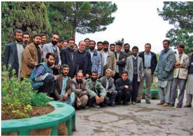
Mitarbeiter und Geschäftsführung der Stadtwerke Ettlingen GmbH standen ihren afghanischen Kollegen mit Rat und Tat zur Seite