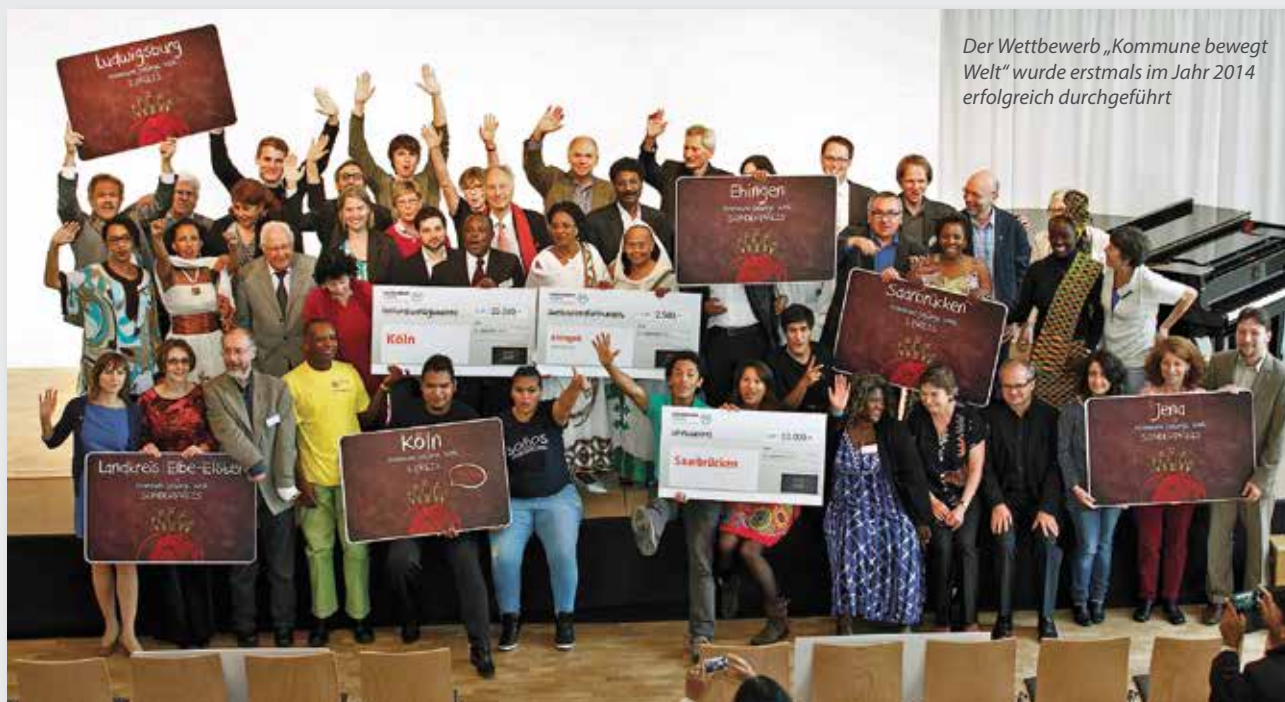
Der Wettbewerb „Kommune bewegt Welt“ wurde erstmals im Jahr 2014 erfolgreich durchgeführt

Wettbewerb „Kommune bewegt Welt“: www.engagement-global.de/wettbewerb-kommune-bewegt-welt.html