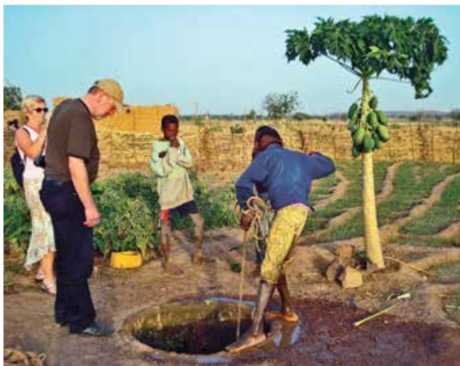
Im Rahmen einer Dreierpartnerschaft unterstützen die Städtepartner Würselen in Nordrhein-Westfalen und Morlaix in Frankreich ihre Partnerstadt Réo in Burkina Faso beim Brunnenbau

Im Kontext von De-Kolonialisierung und der Herausbildung unabhängiger Nationalstaaten in der südlichen Hemisphäre entwickelte sich dann in den 1970er- und 1980er-Jahren ein steigendes kommunales Interesse auch an Partnerschaften mit Kommunen im Globalen Süden, das noch durch die Herausforderungen der Globalisierung verstärkt wurde. Mehr als 500 Kommunen in Deutschland unterhalten aktuell Beziehungen zu Städten in Asien, Afrika und Lateinamerika. Diese Kommunalpartnerschaften sind heute wesentlich für die – wenn nicht sogar die Basis der – Kommunalen Entwicklungszusammenarbeit.