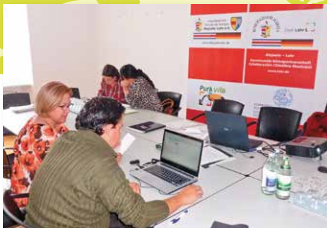
Die Städtepartner Lahr und Alajuela haben gemeinsam ein Handlungsprogramm zum Klimaschutz erarbeitet, das in den nächsten Jahren umgesetzt werden soll