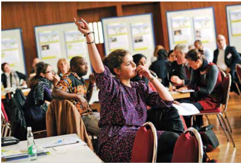
Das bundesweite Netzwerk Migration und Entwicklung fördert den Erfahrungsaustausch zwischen entwicklungspolitisch aktiven Akteuren und Migrantenorganisationen vor Ort