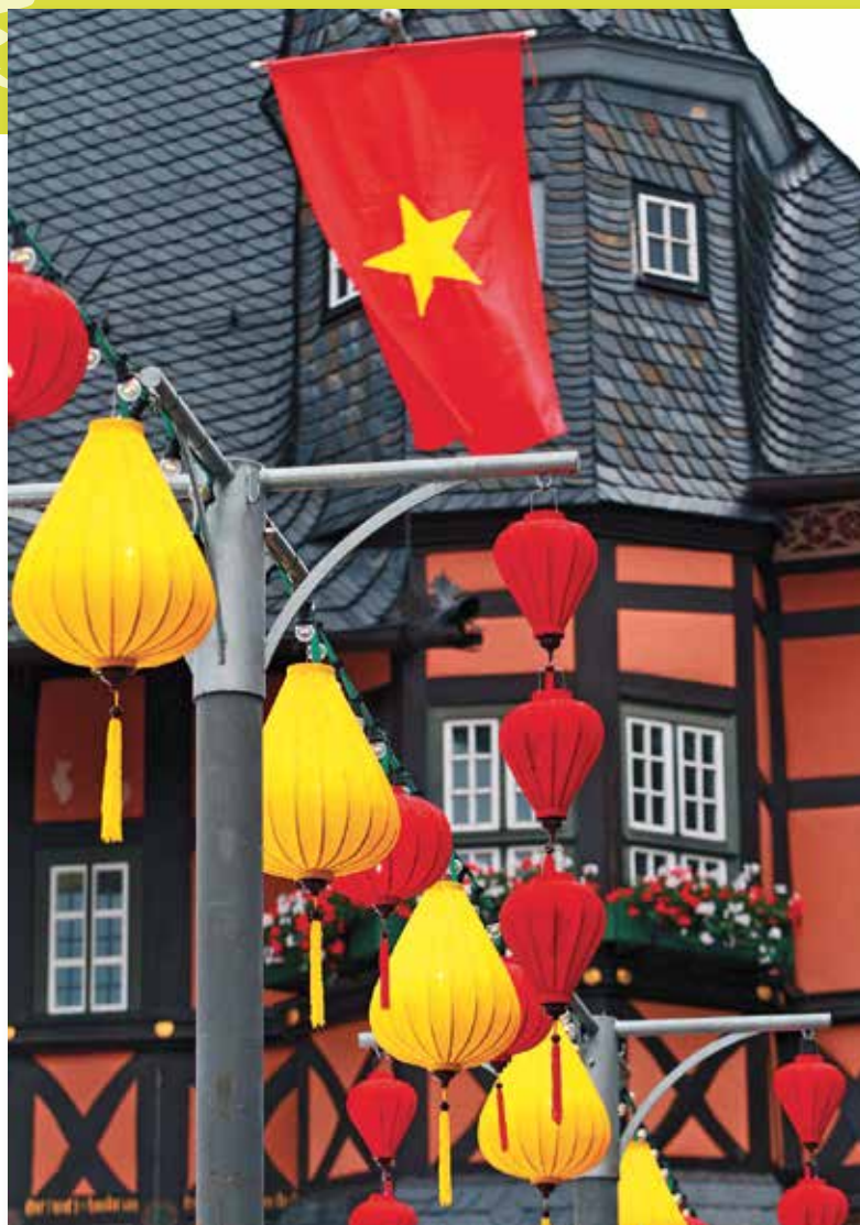
Hunderte handgefertigte Lampions aus Hoi An schmückten beim Lampionfest im Juli 2013 die Altstadt von Wernigerode

Der Bereich Städtepartnerschaften ist bei der Stadt Wernigerode zentral im Büro des Oberbürgermeisters angesiedelt. Darüber hinaus besteht ein ehrenamtlich agierendes Netzwerk, das von zwei Vereinen im Bereich der Partnerschaftsarbeit unterstützt wird. Hierzu zählt der Verein „Wernigeröder Interkulturelles