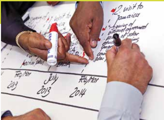
Im Rahmen des Projektes „50 Kommunale Klimapartnerschaften bis 2015“ erarbeiten Kommunen des Globalen Nordens und Südens gemeinsam Handlungsprogramme für Klimaschutz und Anpassung an den Klimawandel

der eigenen Kommune anzusprechen, um zu eruieren, ob hier bereits internationale Kontakte bestehen, die gegebenenfalls auf die Ebene der Kommunalverwaltung erweitert werden können. Oft sind gerade in mittleren und kleineren Kommunen gute Strukturen zur Bürgerbeteiligung und Einbindung von zivilgesellschaftlichen Akteuren vorhanden, die auch für eine kommunale Partnerschaft genutzt werden können. Gerade für kleinere Kommunen kann es auch von Vorteil sein, sich mit anderen Kommunen aus der Nachbarschaft oder ihrem Landkreis zusammenzuschließen, um gemeinsam eine Partnerschaft mit einer oder mehreren Kommunen im Globalen Süden aufzubauen und sich so gemeinsam zu engagieren.