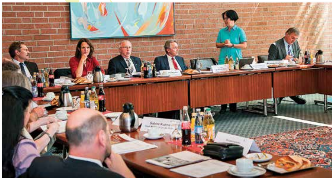
Die Mitglieder des Ausschusses für kommunale Entwicklungszusammenarbeit der Deutschen Sektion des RGRE treffen sich halbjährlich zu Arbeitssitzungen