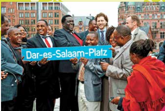
Seit der Einweihung des Dar-es-Salaam-Platzes im Oktober 2013 ist die jüngste Partnerstadt des Stadtstaates Hamburgs im Stadtbild der Hansestadt vertreten

schaft schlossen. So unterzeichneten die Vertreter beider Städte am 26. Juli 2006 eine „Deklaration für Afrika“ zugunsten der Stadt Kangoussi in Burkina Faso, die von allen Partnerstädten Ludwigsburgs mitgetragen wird. Zu den konkreten Projekten zählen der Erweiterungsbau einer Schule und der Bau einer Bewässerungsanlage, wobei sich zahlreiche Vereine, Schulen und andere örtliche Akteure an der Umsetzung und Finanzierung beteiligen.