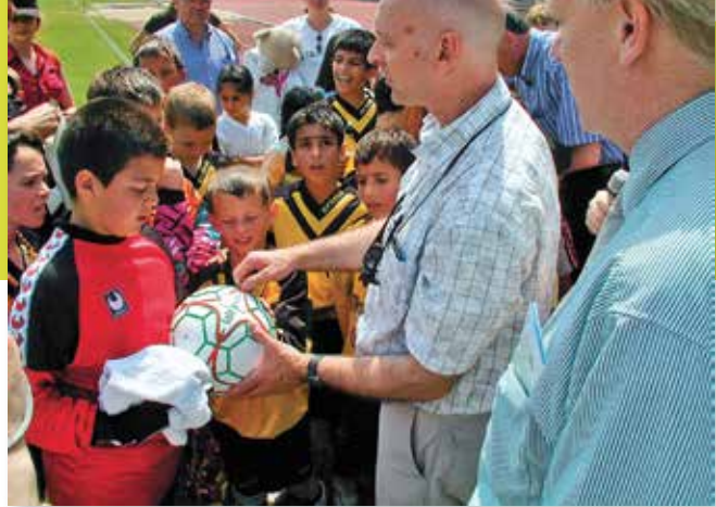
Neben dem fairen Umgang untereinander spielt beim Fußball auch die Verwendung fair gehandelter Bälle eine immer wichtigere Rolle

Als auftragsbezogene und damit zulässige Beschaffung im Sinne der Nachhaltigkeit kann grundsätzlich in der Vergabebekanntmachung und den Vergabeunterlagen nicht nur die Vorgabe gemacht werden, dass bei der Beschaffung von Hölzern, etwa für zu errichtende kommunale Bauten, Tropenhölzer und damit eine Schädigung von Urwäldern ausgeschlossen werden. Auch die Ausschreibung von gebietseigenen (regionalen) Gehölzen muss als vergaberechtlich zulässig angesehen werden. Zwar wird hiermit eine Beeinträchtigung der EU-Warenverkehrsfreiheit (Art. 28 ff. AEUV) vorgenommen. Diese kann aber ausnahmsweise dann gerechtfertigt sein, wenn nur gebietseigene Gehölze dazu führen, dass zum Beispiel die heimische Flora nicht genetisch verändert wird und damit stabil für künftige Entwicklungen wie den Klimawandel bleibt. In diesem Fall kann eine kommunale Vergabestelle aus Umweltschutzgründen bei ihrer Beschaffung im Einzelfall gebietsfremde Gehölze ausschließen.