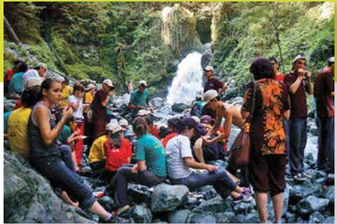
Im Jahr 2006 fand in Telawi ein Sommercamp mit Jugendlichen aus Georgien, Armenien, Aserbaidschan und Deutschland statt

Diesen Partnerschaften wie auch der Freundschaft zu Guernsey lag zunächst das Motiv der Aussöhnung mit vormalig verfeindeten Nationen zugrunde. Der Städtepartnerschaft mit Telawi kommt insoweit eine besondere Bedeutung zu, als dass sie noch zur Zeit der Sowjetunion begründet wurde und über den Aussöhnungsgedanken hinaus als friedensstiftende Maßnahme auf kommunaler Ebene während der Hochrüstungsphase des Kalten Krieges wirken sollte. Im Mittelpunkt standen deshalb Begegnungen zwischen den Bürgerinnen und Bürgern quer durch alle Bevölkerungsschichten unter besonderer Berücksichtigung des Jugend- und Schüleraustausches sowie gemeinsamer Projekte in Sport und Kultur. Darüber hinaus gab es einen Austausch von Fachleuten in den Bereichen des Umweltschutzes sowie des Handels und der Wirtschaft, wobei auch ortsansässige Ausbildungsstätten und zivilgesellschaftliche Organisationen eingebunden waren. Zudem leistete Biberach wertvolle Hilfe beim Aufbau einer Selbstverwaltung in Telawi, vor allem durch Know-how-Transfer.