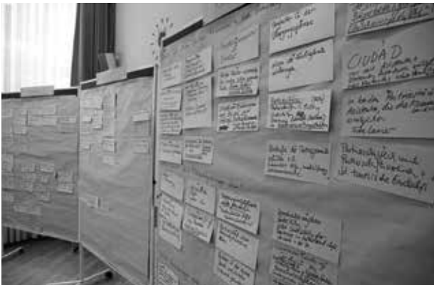
Ein kleiner Ausschnitt der gesammelten Stichworte zu den Themenkomplexen Rollen, Partner und Themen der künftigen Arbeit im Netzwerk deutsch-nordafrikanischer Kommunen – viele Anregungen, die es umzusetzen gilt!