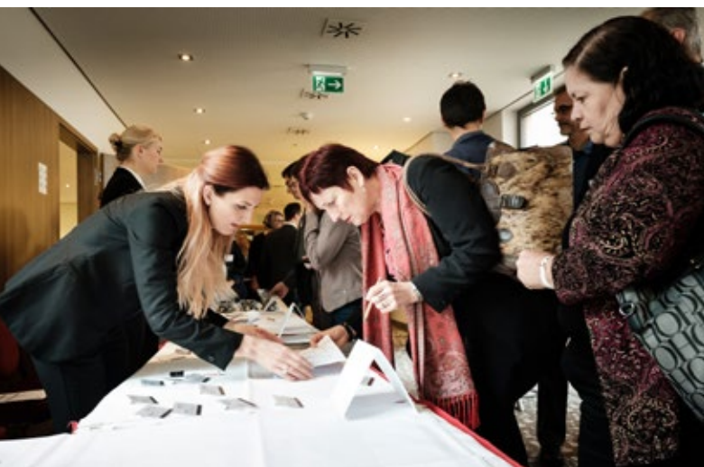
Recepción de asistentes.

La Conferencia constituye una importante plataforma de interconexión en red para todos los municipios alemanes y sus contrapartes en la región en cuestión. Con respecto a los contenidos, la atención del encuentro se centró en el intercambio mutuo de experiencias y éxitos del trabajo de cooperación. En el marco de múltiples talleres, los y las participantes tuvieron la oportunidad, entre otras cosas, de dialogar sobre la oferta de fomento de la SKEW “Desarrollo municipal sostenible mediante proyectos de cooperación” (Nakopa) o sobre ideas de proyectos concretas, máxime teniendo en cuenta que muchos de los y las presentes ya contaban con la correspondiente experiencia. De acuerdo con el título de “Ciudad de los Derechos Humanos” asignado a la ciudad de Núremberg en 2001, el tema de los derechos humanos fue otro de los puntos centrales de la Conferencia.