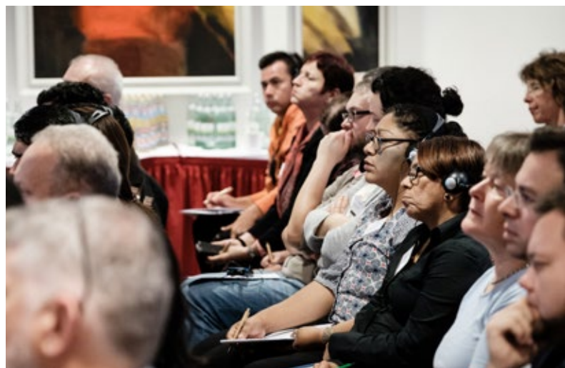
Momento de la sesión plenaria.

el Comité de Secretarios de Estado para el Desarrollo Sostenible alemán adjudicó al proyecto de la SKEW “Global – Lokal: Agenda 2030 VerOrten” 3 (Global – Local: Situando la Agenda 2030) la distinción de proyecto emblemático para la Estrategia de Desarrollo Sostenible alemana.