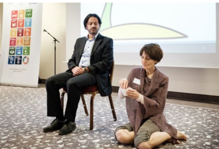
El equipo moderador en la isla de Albatros.

Mediante una secuencia de teatro pantomímico, el equipo moderador representó distintos momentos de la vida de un hombre y una mujer de la isla ficticia de Albatros. En una serie de escenas breves, se presentó al hombre sentado en una silla, mientras la mujer yacía descalza en el suelo junto a él. A continuación, se pidió a los y las participantes que compartieran sus observaciones y apreciaciones. La escenificación podía haber llevado a la conclusión apresurada de que el hombre disfruta de una posición de superioridad respecto de la mujer. Sin embargo, el desenlace de la secuencia reveló que, en la isla de Albatros, a la mujer se le reserva el privilegio de sentarse descalza y directamente en contacto con la madre Tierra.