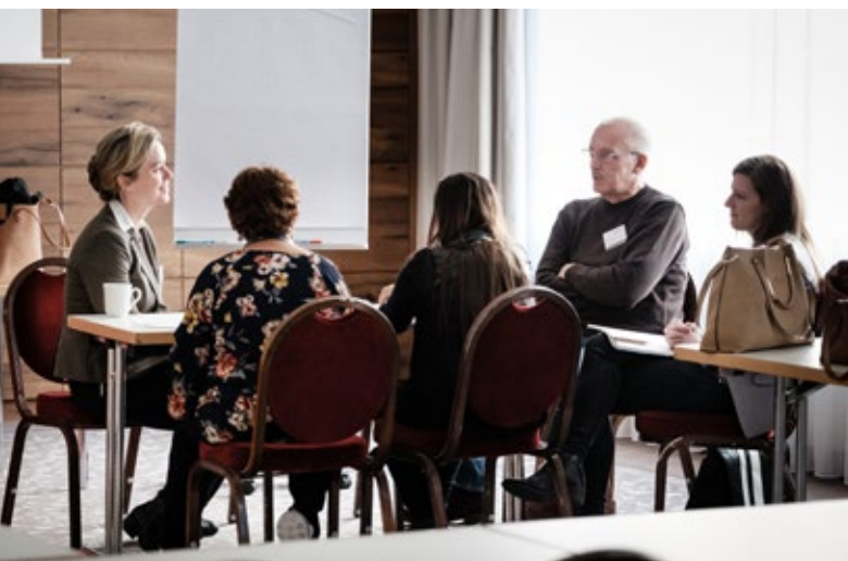
Planificación de acciones en pequeños grupos.

Cerca del final de la Conferencia, los y las representantes municipales se reunieron con el objetivo de planificar acciones conjuntamente. En total, se propusieron diez temas o ideas de proyecto diferentes. Los y las participantes podían quedarse en el lugar asignado a su cooperación, pero también podían moverse libremente por los demás para encontrar posibles inspiraciones, o bien para aportar sus propios conocimientos. Con la ayuda de una guía de planificación, pudieron concretar ideas, analizar detenidamente los siguientes pasos o desarrollar una solicitud de proyecto. También fue posible ponerse de acuerdo sobre el proceso de determinación conjunta de contenidos prioritarios y sobre cómo proseguir con el intercambio.