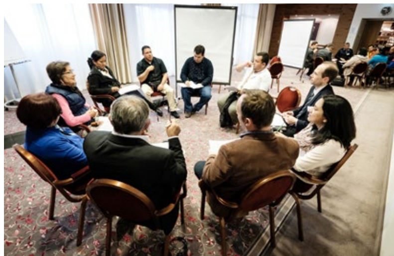
Grupos poniendo en común los criterios de éxito y los efectos de aprendizaje.

Tras las entrevistas, cada grupo debatió sobre estos aspectos, para anotar al final los tres factores de éxito más importantes. En total, se trabajó paralelamente en diez grupos, que acto seguido volvieron a reunirse en el gran grupo para compartir sus conclusiones con los demás.