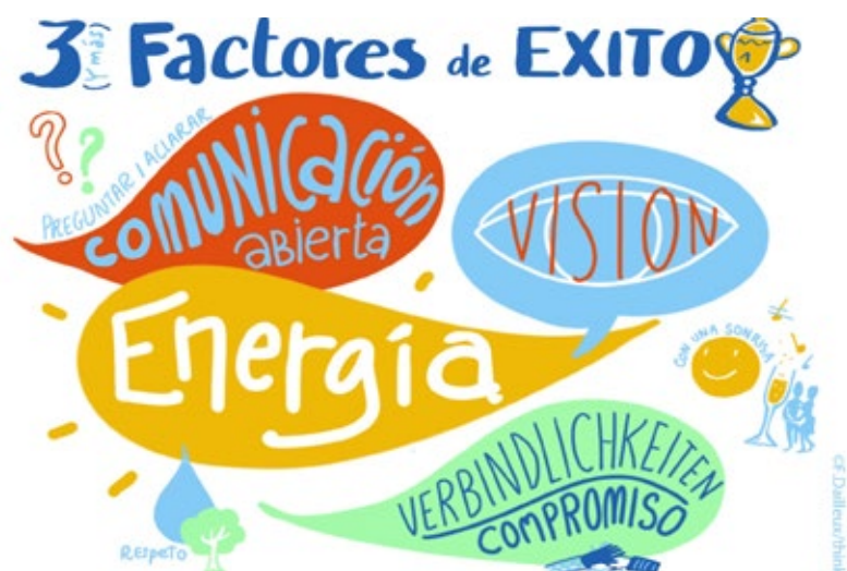
Tres (y más) factores de éxito.