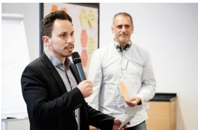
Dos participantes presentando sus resultados.

Distribuidos en pequeños grupos, los y las asistentes hablaron de lo que les había parecido especialmente interesante, de los elementos que podían aprovechar y de los retos que existen actualmente en sus propias cooperaciones. Había generado muy buena impresión el enfoque del aprendizaje mutuo y la valoración de la diversidad, la voluntad de cooperar en ambas ciudades y la gran cantidad de proyectos implementados. Los y