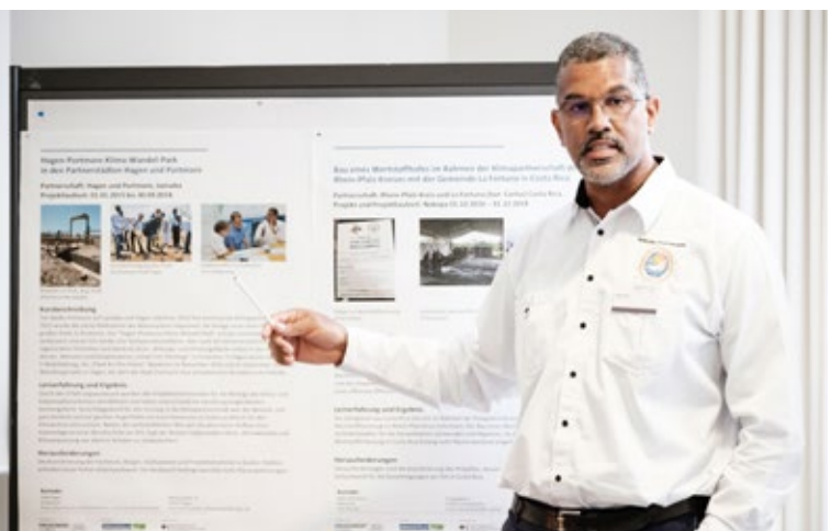
Las ciudades de Portmore y Hagen presentando sus actividades.

De forma simultánea, se celebraron dos talleres sobre el fomento de proyectos de cooperación municipal. Estos talleres permitieron a los y las participantes compartir sus experiencias en el trabajo de proyecto en el marco del proyecto “Desarrollo municipal sostenible mediante proyectos de cooperación” (Nakopa, por sus siglas en alemán) y del “Programa de financiamiento