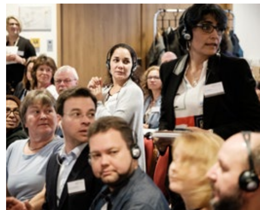
Presentación de distintas cooperaciones municipales.