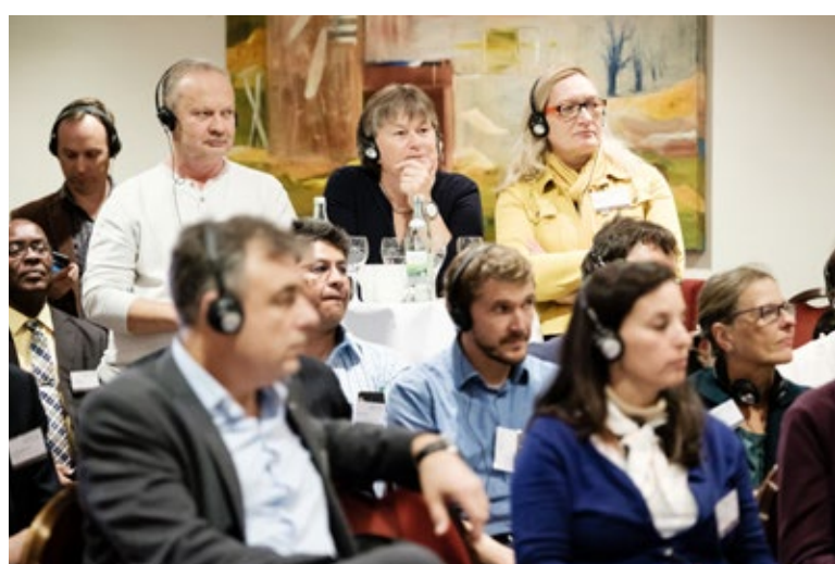
Parte del público de la sesión plenaria.