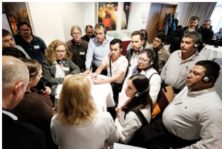
Los servicios ofrecidos suscitaron un gran interés.

Desde el año 2011, el instrumento de financiamiento para el clima FKKP brinda a los municipios y comarcas alemanes la posibilidad de solicitar una subvención para proyectos consistentes en cooperaciones municipales para el desarrollo. La presentación de solicitudes exige como requisito la participación previa en el proyecto «Cooperaciones municipales para el clima».