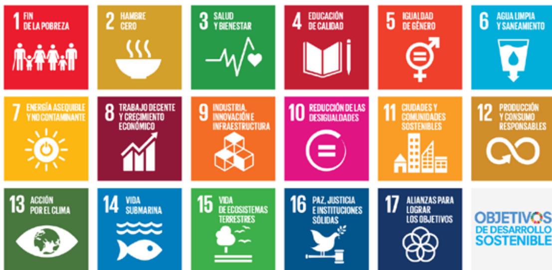
Los 17 Objetivos de Desarrollo Sostenible de la Agenda 2030.