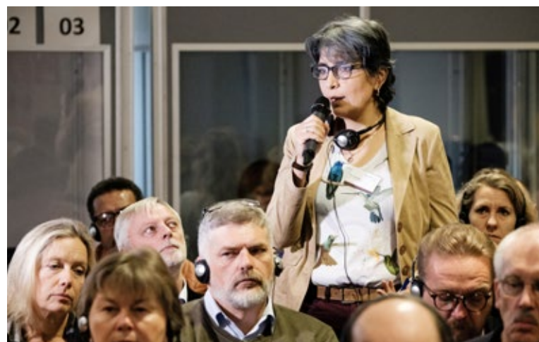
Intervenciones del público.

Numerosas ciudades, comunidades y distritos administrativos han firmado ya un modelo de resolución del Congreso de Municipios Alemanes o han recibido la petición de firmarlo. 6 En América Latina y el Caribe, donde la mayoría de las personas vive en ciudades, los ODS de la Agenda están en consonancia con el “Plan de Acción Regional para la implementación de la Nueva Agenda Urbana en América Latina y el Caribe 2016-2036”. 7