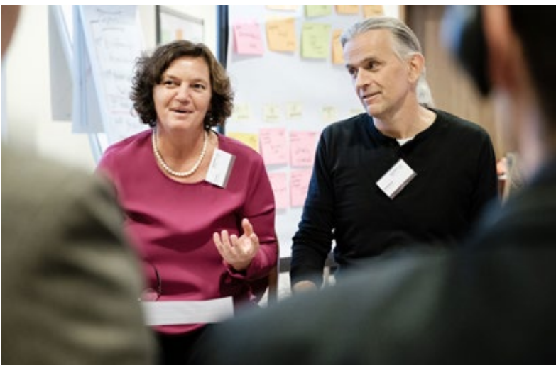
Participantes compartiendo sus experiencias.

Para conocer ejemplos concretos de la labor de cooperación municipal, se utilizó la metodología denominada “indagación apreciativa” (en inglés, “Appreciative Inquiry”). Esta pone el foco en los potenciales existentes con el fin de reforzarlos y ampliarlos. Dos personas debían entrevistarse mutuamente con ayuda de un guion. La entrevista debía girar en torno a un proyecto o una experiencia perteneciente a la cooperación municipal que la persona entrevistada recordase como algo especialmente positivo y satisfactorio. Las preguntas hacían especial hincapié en las aportaciones y las fortalezas de las partes involucradas que habían contribuido al éxito del proyecto común. Las personas que escuchaban las entrevistas debían tomar notas sobre los siguientes: