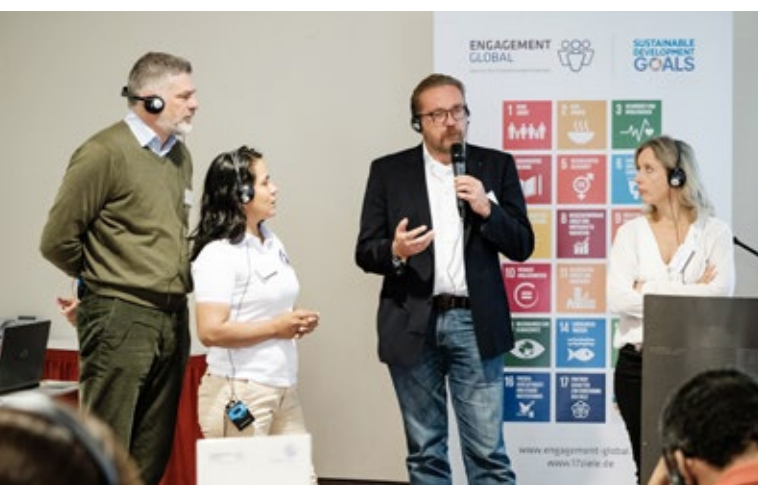
Las contrapartes Schondorf am Ammersee y Puerto Leguizamó presentando sus actividades.

Se formaron tres grupos de diálogo, en los que se trató sobre todo la planificación y ejecución de proyectos concretos, en especial relacionados con el abastecimiento de agua. Se debatió sobre la pla-