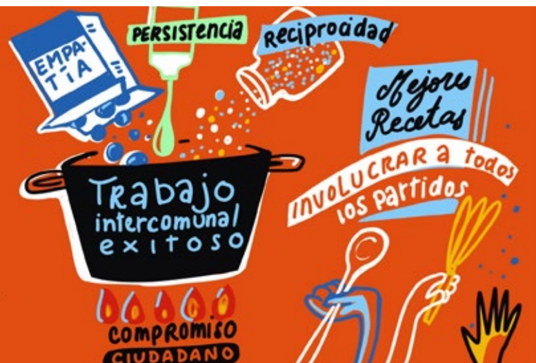
La “receta del éxito” para las cooperaciones municipales.

“El método fue muy efectivo y productivo. El cuestionario nos ayudó a abordar las cuestiones de forma rápida y clara.”