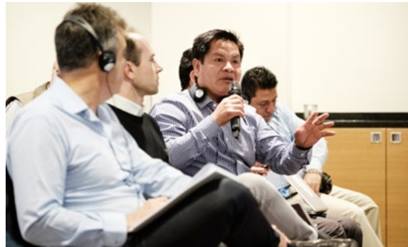
Animado debate sobre los derechos humanos.

Lo mismo ocurre con el aprendizaje mutuo por encima de las fronteras nacionales y las distintas regiones del mundo. Las alianzas mundiales para el desarrollo sostenible tienen su propio Objetivo en la Agenda 2030. Precisamente por esto, hay que celebrar unas cooperaciones municipales en las que se intercambia, se aprovecha y se amplía el know-how municipal. Y también los proyectos de cooperación municipal con América Latina y el Caribe son alentadores en este sentido.