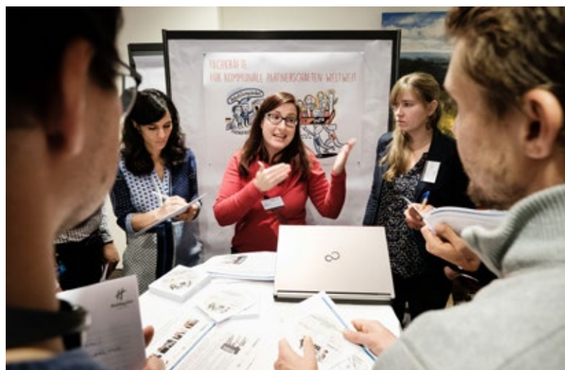
Uno de los “puestos del mercado”.