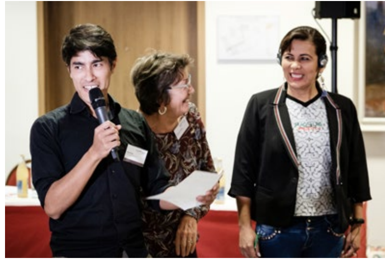
Diálogo intercultural en la práctica.