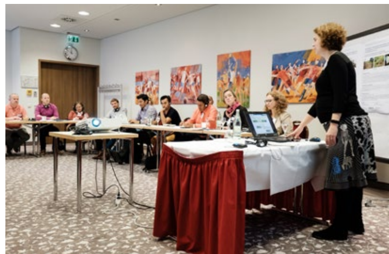
Aclarando cuestiones en el taller.

de proyectos municipales de protección climática y adaptación al cambio climático” (FKKP, por sus siglas en alemán). Las ponentes presentaron los proyectos con ayuda de pósteres preparados para la ocasión y debatieron sobre los aspectos destacados y los retos. Se abordaron también las disposiciones más importantes en cuanto a ejecución administrativa de los proyectos, en especial las nuevas disposiciones sobre el proceso de licitación y las relativas a la utilización de los fondos, las constelaciones de actores y la labor de información. Además, se aclararon los requisitos de la elaboración de comprobantes. En particular, los actores de los municipios contraparte agradecieron la posibilidad de recibir “de primera mano” información relativa a los requisitos administrativos de la ejecución de proyectos.