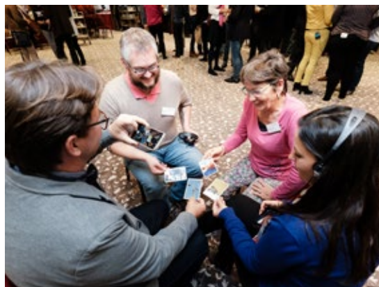
Participantes usando tarjetas con dibujos simbólicos sobre cooperaciones exitosas.