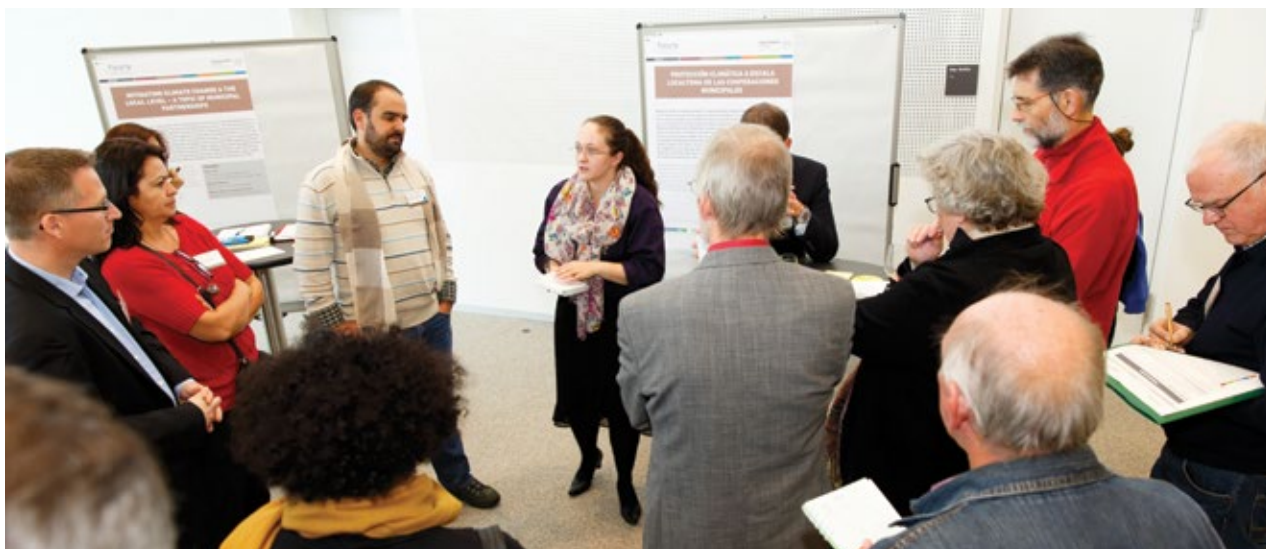
Participantes durante el espacio abierto sobre temas de la labor de cooperación

La conferencia brindó la oportunidad de abrir un espacio abierto sobre seis temas generales de la labor de cooperación. En dos rondas, los participantes se reunieron para discutir sus propias preocupaciones. El teatro de improvisación hispano-alemán «Lux - Theater des Moments» puso en escena las impresiones obtenidas en el espacio abierto