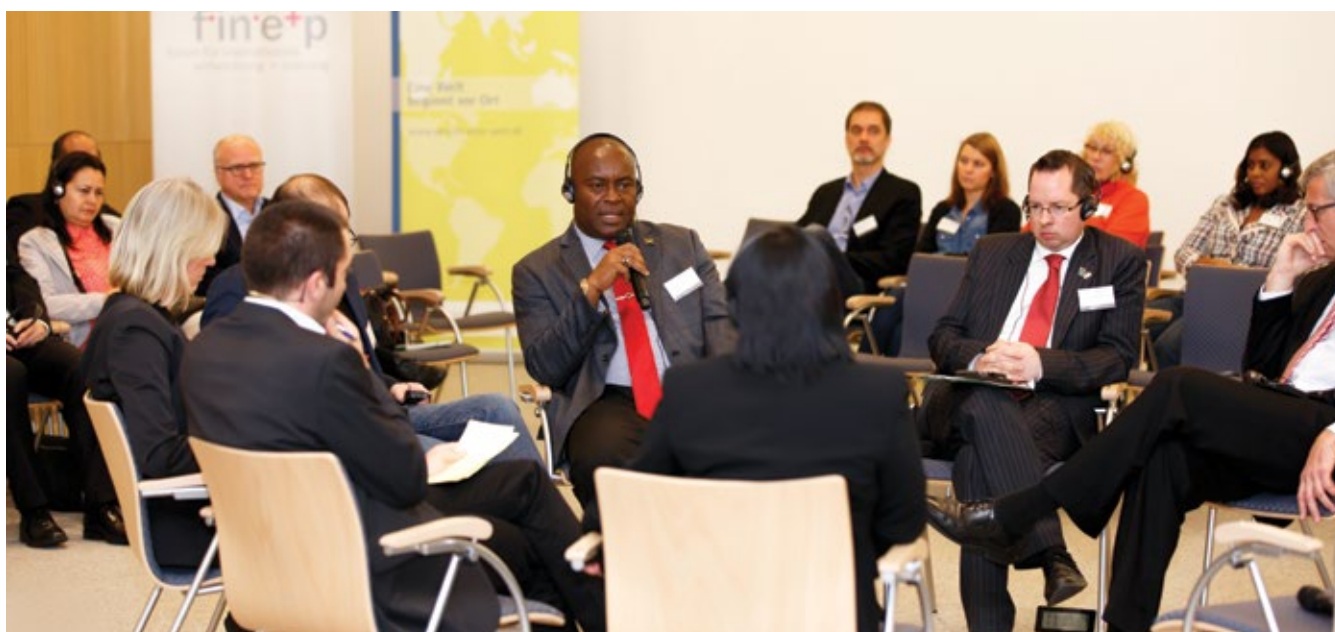
Ronda de discusión en formato de pecera sobre la cuestión: ¿Cuán política puede y debe ser la política municipal de desarrollo?