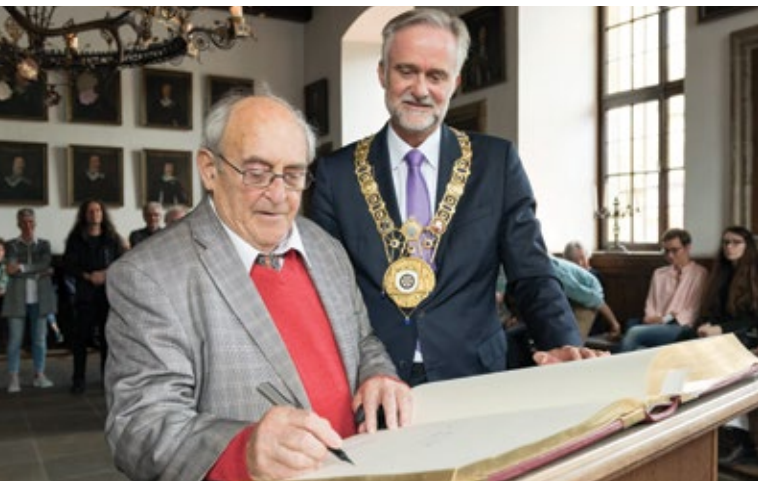
Menschenrechtler und Anti-Apartheidskämpfer Denis Goldberg zu Gast in Osnabrück.

Als Stadt des Westfälischen Friedensschlusses von 1648 fühlt sich Osnabrück in einer besonderen Weise verpflichtet, sich friedenspolitisch und friedenskulturell zu engagieren. Träger der Osnabrücker Friedenskultur ist nicht nur die Kommune. In enger Kooperation mit zahlreichen bürgerschaftlichen Initiativen und Vereinen sowie friedens- und entwicklungspolitisch ausgerichteten Institutionen gestaltet die Stadt das Engagement für den Frieden einerseits als Querschnittsaufgabe, andererseits aber auch durch das bundesweit einmalige städtische Büro für Friedenskultur. Das Büro und seine Kooperationspartner sind in den Handlungsfeldern Friedenskultur, Interkultur, Internationaler Dialog und Erinnerungskultur aktiv.