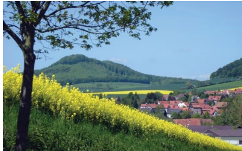
Landschaft im Kreis Göttingen.

Wichtig ist, dass es um konkrete Projekte geht, über die nachhaltige Entwicklung verstanden und veranschaulicht werden kann. Es geht nicht um das Abarbeiten abstrakter Ziele. Die SDGs müssen mit konkreten Umsetzungsbeispielen erlebbar gemacht werden. Viele Personen sind durch ihre Erfahrungen mit dem Engagement zur „Lokalen Agenda“ Mitte der 90er-Jahre ernüchtert. Daher darf man die Menschen nicht überfordern oder zu hohe Erwartungen schüren. Es müssen praktische Anknüpfungspunkte gefunden werden.