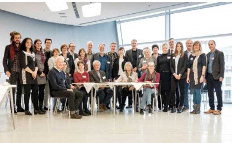
„Netzwerktreffen für deutsche Kommunalakteure mit Partnerschaften in die Region Nordafrika“ der SKEW in Wolfsburg, 30.11./01.12.2017.

Die Stadt Wolfsburg zählt zu den ersten deutschen Kommunen, die von der SKEW für die Förderung einer zweijährigen Personalstelle zur „Koordination kommunaler Entwicklungspolitik“ 11 ausgewählt wurden.