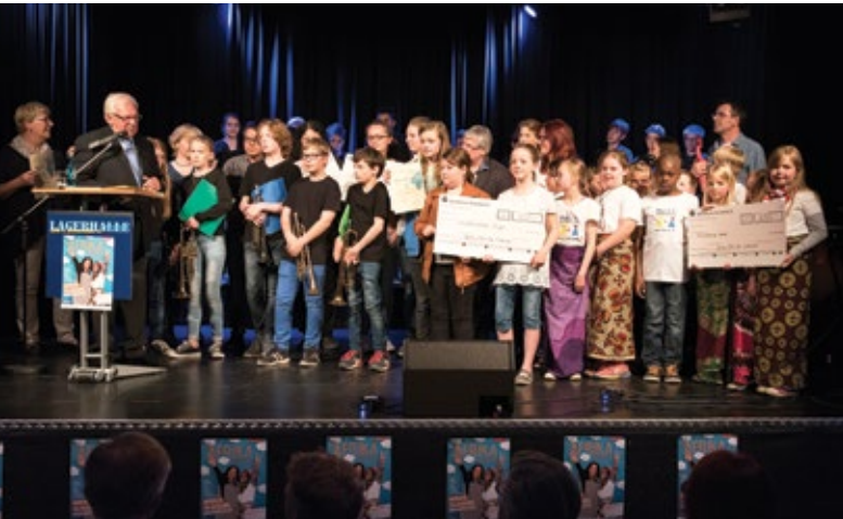
Verleihung des „Afrika Preises“ für Schulen anlässlich der Eröffnung des „Afrika Festivals Osnabrück“ 2016.

Osnabrück ist entwicklungspolitisch nur so gut wie seine Kooperation mit starken Partnern. Die Stadt hat mit terre des hommes eine weltweit aktive Kinderhilfsorganisation an ihrer Seite, die sie im Bereich der lokalen entwicklungspolitischen Bildungs- und Öffentlichkeitsarbeit auch finanziell fördert. Das Aktionszentrum 3. Welt, ein lokaler Eine-Welt-Verein, wird ebenfalls finanziell unterstützt und ist eines der größten entwicklungspolitischen Zentren in Niedersachsen. Osnabrück ist 2010 als „Fairtrade-Town“ ausgezeichnet worden. Die Stadt Osnabrück erfüllte auch 2017 noch alle fünf Kriterien der „Fairtrade-Towns“-Kampagne und trägt für weitere zwei Jahre den Titel.