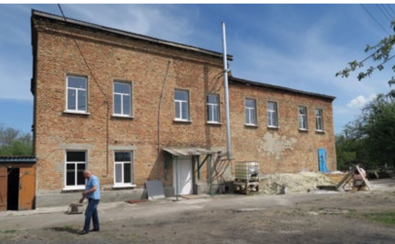
Das Korsuner Wasserwerk.

Die Förderung über das sogenannte „Schnellstartpaket Ukraine“ 3 im Projekt „Kommunale Partnerschaft mit der Ukraine“ von SKEW/Engagement Global bot 2017 die Möglichkeit, ein konkretes Projekt in Korsun anzugehen. Ziel war, entwicklungspolitische Strukturen der Zusammenarbeit aufzubauen bzw. zu festigen, engagierte Akteure in beiden Städten zu vernetzen und somit eine nachhaltige Entwicklung in beiden Kommunen zu fördern. Die Erarbeitung von Bauanträgen und technischen Dokumentationen auf dem neuesten Stand der europäischen Wasserwirtschaft zur Erweiterung des Wasserleitungsnetzes und eine intensive gesellschaftliche Auseinandersetzung mit Fragen der Ressourcennutzung und des Umweltschutzes in Korsun und in Gifhorn bildeten die beiden Seiten dieses ambitionierten Projektes unter dem Titel „Sauberes Wasser für Korsun“. Die Akzeptanz für das Projekt war in Gifhorn sehr hoch. Das drückte sich darin aus, dass der Rat der Stadt Gifhorn eine Resolution zu diesem Projekt am 12. Juni 2017 einstimmig beschlossen hat.