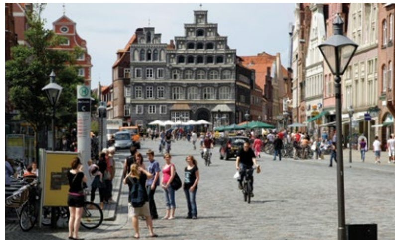
Lüneburger Platz „Am Sande“.

Ein Schwerpunkt, an dem wir beispielsweise bereits gemeinsam mit Studierenden weiterarbeiten, ist der Bereich der Klimaanpassung. Hier haben wir gezielt alle Visionen noch einmal durchgesehen und die Aspekte gesammelt, die dafür relevant sind. Jetzt prüfen wir, wie die Ausgangsbedingungen und unser Handlungsrahmen in Lüneburg sich gestalten. Welche Projekte gibt es schon, welche gesetzlichen Regelungen müssen wir beachten, was sind die größten Herausforderungen, denen wir begegnen sollten? Wo sind zum Beispiel Windschneisen, die wir erhalten sollten? Parallel erkunden wir Erfolgsgeschichten außerhalb Lüneburgs, die wir vielleicht anpassen und übertragen könnten. In einem Workshop im Herbst werden wir gemeinsam mit Lüneburger Akteuren diese Ideen diskutieren und weiter ausarbeiten, und im Anschluss prüfen wir, welchen Beitrag in Richtung Nachhaltigkeit diese möglichen Veränderungen leisten könnten und ob sie sich überhaupt alle miteinander umsetzen ließen. Wir versuchen also, Zielkonflikte von vornherein auszuschließen.