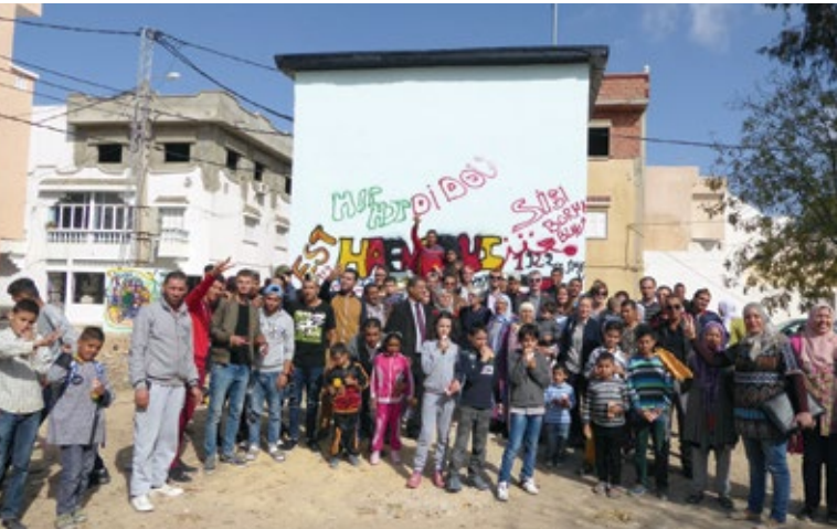
Während des Fachaustausches in Jendouba wird ein Graffiti-Workshop mit den Anwohnerinnen und Anwohnern organisiert, 28.10.2017.

Entwicklungen durch unser lokales Handeln beeinflussen und deshalb Verantwortung dafür übernehmen müssen. Wir müssen weiterdenken! Die kommunale Entwicklungszusammenarbeit knüpft an dieser Stelle an“, so der Oberbürgermeister in einem Interview für das Magazin „der gemeinderat“ 2017.