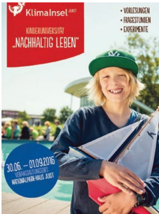
Plakat der Kinderuniversität „Nachhaltig Leben“.

Juist ist mit 1.700 Einwohnerinnen und Einwohnern eine kleine Gemeinde. Den Herausforderungen einer Insel in der Nordsee und im Weltnaturerbe Wattenmeer versuchen wir durch innovative und kreative Nachhaltigkeitsmaßnahmen zu begegnen. Dabei nutzen wir den Wirtschaftsfaktor Tourismus als Katalysator einer nachhaltigen Entwicklung.