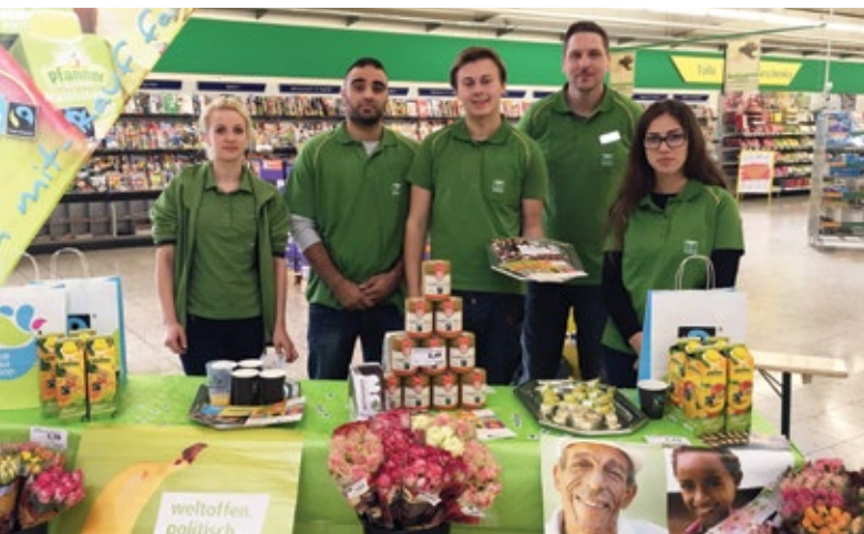
Schülerinnen und Schüler der Handelslehranstalt Hameln werben alljährlich in Supermärkten für fair gehandelte Produkte.

Diese Erfolge sind das Ergebnis eines breit angelegten, partizipativen und transparenten Prozesses in der Kreisverwaltung. Der Landrat hat das Thema Nachhaltigkeit zur Chefsache erklärt und bereits 2011 eine interdisziplinäre und dezer-natsübergreifende AG Klimaschutz gegründet, zu der Leiterinnen und Leiter aus Schlüsselämtern (Informationstechnologie, Zentrale Dienste, Rechnungsprüfungsamt, Bauverwaltung, Facility-Management, Kreisabfallwirtschaft etc.) per Landratsanweisung dienstverpflichtet wurden.