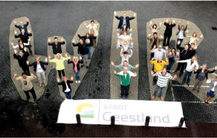
Unser „WIR“.

Die Stadt Geestland sieht die Verantwortlichkeit ihres Handelns in dem ganzheitlichen Spektrum der 17 SDGs. Seit 2008 ist dies ein kontinuierlicher Prozess, dem sich die Stadt in ihrer Gesamtheit widmet. Einige Beispiele: