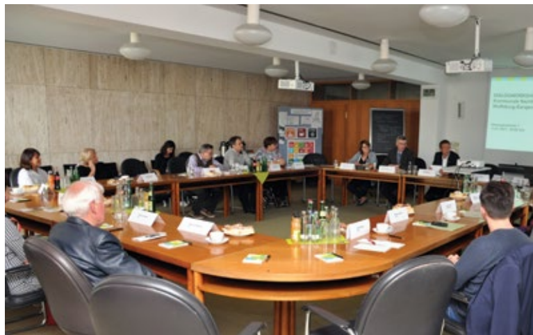
Dialogworkshop zum Projekt „Kommunale Nachhaltigkeitspartnerschaften“.

um diese innerhalb kommunaler Prozesse zu verankern. Wolfsburg und Sarajevo werden eine Projektmaßnahme im Bildungsbereich zum Thema Nachhaltigkeit in beiden Städten entwickeln und sich dazu austauschen. Im Juli 2017 wurden Interessenten aus Politik, Verwaltung und Zivilgesellschaft in Wolfsburg zu einem gemeinsamen Dialogworkshop eingeladen, um die kommunale Entwicklungszusammenarbeit, das Pilotprojekt und die Agenda-Arbeit der Stadt kennenzulernen. Gemeinsam wurden Ideen für ein Bildungsangebot erarbeitet. Nach dem Netzwerktreffen der projektbeteiligten deutschen Kommunen konnte die Delegation aus Sarajevo im Januar 2018 im Rahmen einer Expertenentsendung in Wolfsburg empfangen werden. Der Fachaustausch diente der gemeinsamen Konkretisierung der jeweiligen Bildungsprojekte in Arbeitssitzungen und dem Kennenlernen unterschiedlicher lokaler Nachhaltigkeitsinitiativen.