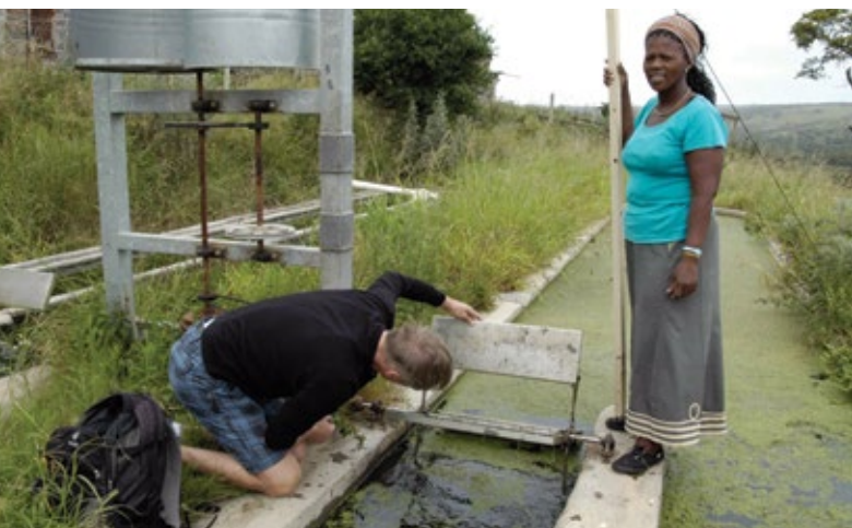
Vor-Ort-Termin im Rahmen einer Entsendung der Klimapartnerschaft im Januar 2015.

Oldenburg ist in der internationalen Zusammenarbeit breit aufgestellt. Neben den klassischen Partnerschaften sind wir im Bereich kommunaler Entwicklungszusammenarbeit in China und Südafrika tätig. Der Austausch ist in der Regel projekt- und themenbezogen. Seit 2012 hat Oldenburg eine strategische Partnerschaft mit der südafrikanischen Kommune Buffalo City Metropolitan Municipality (BCMM). Diese liegt in Niedersachsens Partnerprovinz Eastern Cape. Die Zusammenarbeit basiert auf einer „Declaration of Intent“, einer Absichtserklärung, die am 29. November 2012 unterzeichnet wurde.