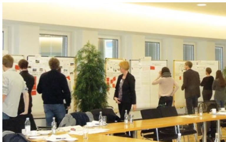
Mitarbeitende bei der Bewertung der Vorschläge.

Der erste Schritt bestand – zur zeitlichen Entlastung der Beschäftigten – in einer Literatur- und Internetrecherche des beauftragten Büros, das alle Programme, Projekte und Verwaltungsdrucksachen zum Thema Nachhaltigkeit erfasste und deren Inhalte den SDGs und ihren Unterzielen zuordnete.