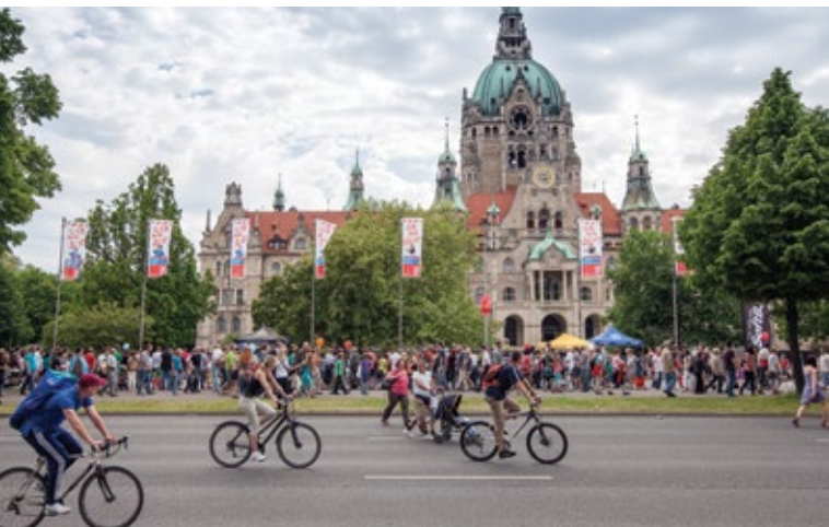
Rathaus: „Autofreier Sonntag“ mit über 240 Akteure und 120.000 Besucherinnen und Besuchern.

nachhaltige Entwicklung“ bereit, regt Initiativen zu nachhaltigem Konsum und Fairem Handel an, koordiniert Projekte zu globalen Partnerschaften, unterstützt das bürgerschaftliche Engagement und fördert die Vernetzung. Eine weitere Querschnittsaufgabe ist es, innerhalb der Verwaltung Strategien eines integrierten Nachhaltigkeitsmanagements zu entwickeln und sich dazu mit anderen Kommunen und Akteuren auszutauschen.