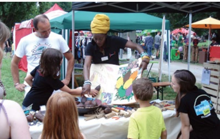
„Fairtrade“: Alles Kakao – Schokolade und Fairer Handel.