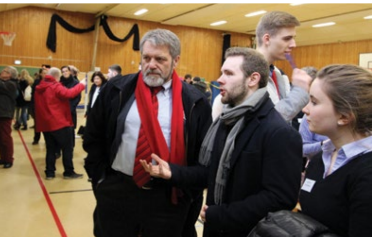
Workshop an der Leuphana Universität.