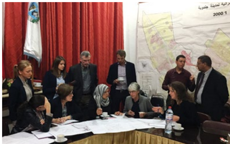
Die Wolfsburger Projektgruppe bei einer Arbeitssitzung im Rathaus von Jendouba, 28.10.2017.

Dazu gehören die grundlegende Bewusstseinsbildung in Politik und Verwaltung sowie die Schaffung funktionsfähiger Strukturen der kommunalen Entwicklungszusammenarbeit. Außerdem wird ein Ratsbeschluss angestrebt, der an die „Wolfsburger Agenda 21“ anknüpft. Ein Forum entwicklungspolitisch aktiver sowie interessierter Akteure aus Wolfsburg wurde bereits ins Leben gerufen, um das vorhandene Wissen und vielseitige Engagement zu bündeln und Erfahrungsaustausche anzustoßen. Parallel gibt es erste projektbezogene Entwicklungspartnerschaften: In Wolfsburg wird kommunale Entwicklungszusammenarbeit als Querschnittsaufgabe definiert, die in ihrer Vielschichtigkeit Herausforderungen und zugleich Chancen birgt. Durch die Zusammenarbeit und gemeinsame Entwicklung mit den Akteuren vor Ort, den Fachverantwortlichen und den Partnern im Ausland kann globales Denken in allen Köpfen verankert werden und sowohl gesamtstädtisch als auch ganz individuell nachhaltiges Handeln wachsen. Deshalb werden bei allen Aktivitäten die globalen Nachhaltigkeitsziele der Agenda 2030 mitgedacht.