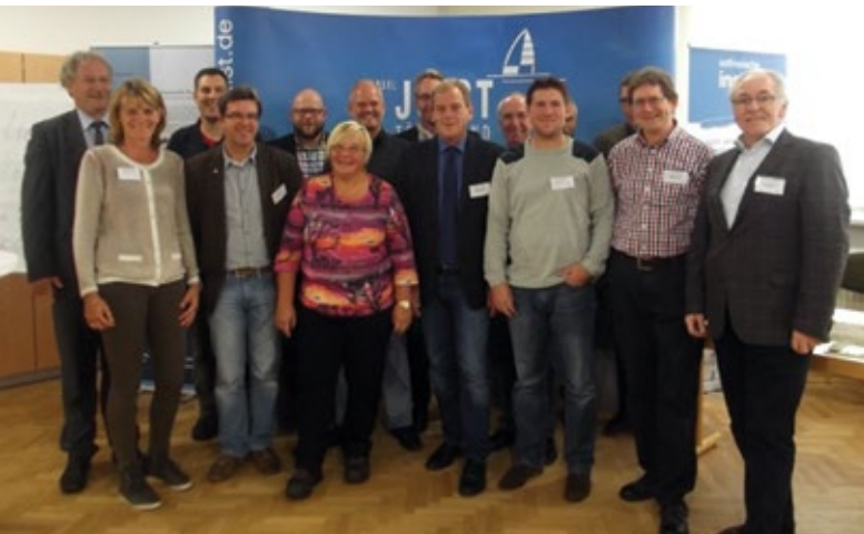
Gruppenfoto der Teilnehmenden des „Gäste-Parlaments“.

Zum Monitoring der Maßnahmen haben wir 2008 und 2010 jeweils einen CO 2 -Fußabdruck erstellt. Dabei wurden der Istzustand und die Nutzungsmöglichkeiten der regenerativen Energien mit Fokus auf Wind, Sonne, Geothermie und Biomasse eruiert. Unsere Insel ist Bestandteil des Nationalparks „Niedersächsisches Wattenmeer“ und des UNESCO-Weltnaturerbes Wattenmeer. Wir sind ein Hotspot der Biodiversität in Deutschland, denn ungefähr ein Viertel der Flora und ein Fünftel der Fauna in Deutschland sind auf den Ostfriesischen Inseln bei 0,03 Prozent der Gesamtfläche beheimatet. Mit dem BUND führen wir die Projekte „Pestizidfreie Kommune“ und „Plastikfreie Inselumwelt Juist“ durch.