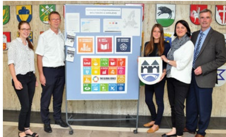
Dialogworkshop zum Projekt „Kommunale Nachhaltigkeitspartnerschaften“.

Zusammenarbeit (GIZ) durchgeführt wird. Durch Wissens- und Erfahrungsaustausche werden Kleinprojekte in Tunesien, Marokko und Algerien im Bereich der Stadtentwicklung unterstützt. Zwischen Wolfsburg und Jendouba finden Austausche zur Gestaltung eines Stadtteilparks mit Bürgerbeteiligung in der tunesischen Freundschaftsstadt statt. Demokratie und Integration profitieren von der Verknüpfung von Stadtentwicklung und Partizipation besonders. Die Wolfsburger Fachbereiche unterstützen das Vorhaben in beratender Funktion. Zwei Mitarbeitende der Stadt Jendouba konnten im Frühjahr die Wolfsburger Kolleginnen und Kollegen, ähnliche Projekte vor Ort und die Projektgruppe kennenlernen. Gemeinsam wurde ein Aktionsplan ausgearbeitet. Der fachliche Gegenbesuch zur weiteren gemeinsamen Konkretisierung der Vorhaben erfolgte im Herbst 2017 in Tunesien, bevor in Wolfsburg das zweitägige „Netzwerktreffen für deutsche Kommunalakteure mit Partnerschaften in die Region Nordafrika“ der SKEW stattfand.