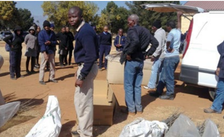
Obstbaumprojekt Pitseng High School, Lieferung der 150 Apfelbäume.

Im Jahr 2016 hat sich der Rat der Stadt Geestland mit der Resolution „2030 – Agenda für Nachhaltige Entwicklung: Nachhaltigkeit auf kommunaler Ebene gestalten“ des Deutschen Städtetages und der Deutschen Sektion des Rates der Gemeinden und Regionen Europas befasst und die von den Vereinten Nationen verabschiedeten Nachhaltigkeitsziele für die Stadt als verbindlich erklärt. Die Durchführung und Einhaltung der Strategie wird durch periodische Nachhaltigkeitsberichte sichergestellt.