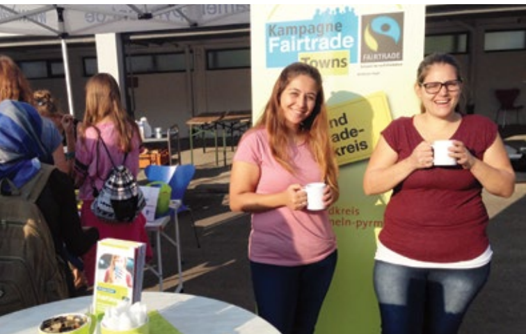
„Faires Frühstück“ für Lehrerinnen und Lehrer.

Im Juli 2012 beschloss der Kreistag des Landkreises Hameln-Pyrmont eine nachhaltige Beschaffungsrichtlinie, die festlegt, dass „die Kreisverwaltung Hameln-Pyrmont alle Anstrengungen unternimmt, bis zum Jahr 2020 100% seiner Ausschreibungen im eigenen Wirkungskreis ökologisch nachhaltig zu gestalten.“