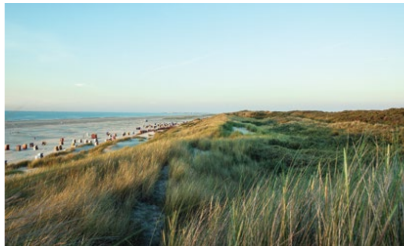
Insel Juist: Sandstrand mit Strandkörben am Meer.

Eine zentrale Stellung in unserer Nachhaltigkeitspolitik nimmt der Klimaschutz ein, nicht zuletzt da die Insel durch Sturmfluten und den Anstieg des Meeresspiegels unmittelbar von den Folgen des Klimawandels betroffen ist. Die entwickelten und zum Teil bereits durchgeführten Maßnahmen basieren auf einem „Integrierten Energie- und Klimaschutzkonzept“, das im Rahmen einer interkommunalen Zusammenarbeit mit Norderney, Baltrum und Norden erarbeitet wurde. Einen Klimaschutzmanager haben wir zum 1. Dezember 2015 gemeinsam mit der Stadt Norden eingestellt, um die geplanten Maßnahmen umzusetzen. Die Projekte „KlimaInsel Juist“ und „Energiewende Juist“ beinhalten umfassende Maßnahmenpakete für Unternehmen, Bevölkerung und Gäste zur Erreichung der angestrebten und für die Insel prioritären Klimaneutralität bis 2030. So wollen wir einen Klimaschutzfonds entwickeln, der aus freiwilligen Abgaben von Gästen gespeist wird. Strom aus regenerativen Quellen nutzt die Inselgemeinde bereits seit Jahren. Der Druck aller Printzeugnisse und der gesamte Postversand geschehen klimaneutral. In unserer Kläranlage setzen wir eine Solartrocknungsanlage ein, mit der wir jährlich 219 Tonnen CO 2 einsparen. Auf unserem Schwimmbad haben wir eine moderne Anlage zur solaren Wassererwärmung errichtet. Für die Straßenbeleuchtung kommen zu 90 Prozent LED-Lampen zum Einsatz.