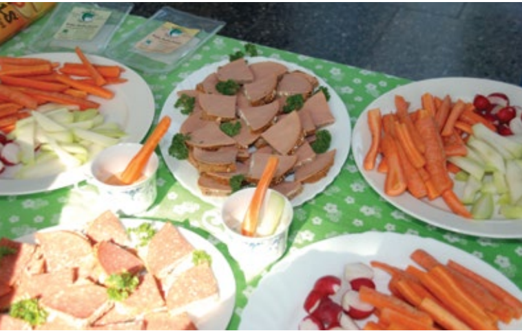
Vegan bietet Abwechslung.

Wichtig dabei ist, dass sich der „Chef der Verwaltung“ an die Spitze der Bewegung stellt, mit gutem Beispiel glänzt und in regelmäßigen Mitarbeiter Rundschreiben zu unterschiedlichen Schwerpunkten alle Beschäftigten auffordert mitzumachen, mitzudenken und sich einzubringen. Zudem sollte die Verwaltungsspitze Wettbewerbe und Prämierungen persönlich vornehmen, um die Wertschätzung des Engagements deutlich zu machen. Preise wie freie Tage, fair gehandelte Präsentkörbe, Energiemessgeräte oder etwa vegane Kochbücher können dabei einen Doppelnutzen erfüllen. Um Kompetenz zu bündeln und weiterzuentwickeln, wäre langfristig ein zentrales Beschaffungswesen als Dienstleister für alle Abteilungen in der Kommunalverwaltung von großem Vorteil.