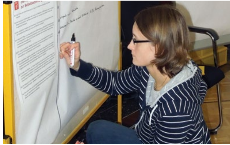
Mitarbeiterin bei der Bewertung der Vorschläge.

www.hannover.de/Leben-in-der-Region-Hannover/ Umwelt-Nachhaltigkeit/Nachhaltigkeit/Regionale- Agenda-2030