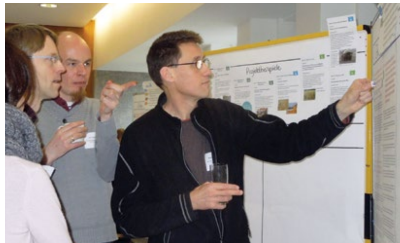
Mitarbeitende bei der Bewertung der Vorschläge.

Im Prozessverfahren haben sich die enge Zusammenarbeit innerhalb der Verwaltung und der Austausch mit der Leitungsebene als sehr wichtig erwiesen, um den optimalen Zugang zu Quellen sowie die Möglichkeit für Nachfragen zu gewährleisten und ein aussagekräftiges Ergebnis zu erzielen.