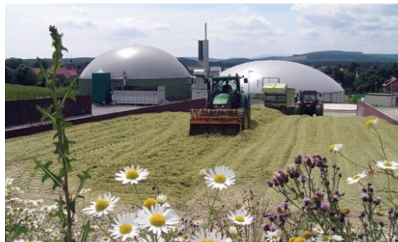
Bioenergiedorf Jühnde.

auch spannende Kombinationen aus Neubürgern – den sogenannten Zugezogenen – und Alteingesessenen mit sehr unterschiedlichen kulturellen Hintergründen und Erfahrungen. Jedoch verändert sich das Engagement auch auf dem Dorf. Viele jüngere Menschen haben keine Lust, sich in einem Verein für 30 Jahre als Vorsitzender zu binden. Sie engagieren sich in Bereichen, die ihnen in dem Moment Spaß machen. Insgesamt müssen wir aber beachten, dass das ehrenamtliche Engagement Einzelner nicht überfordert wird. Die Verantwortung und der zeitliche Aufwand der in den Bioenergiedörfern engagierten Menschen waren beispielsweise extrem hoch.