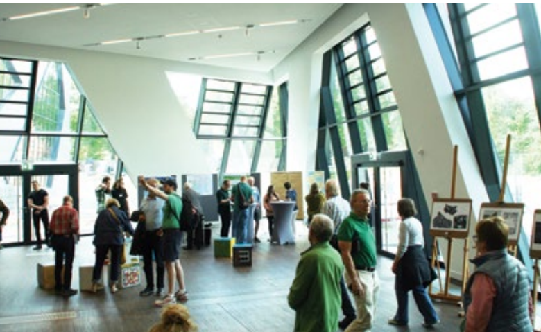
Raum in der Leuphana Universität in Lüneburg.

Es ist doch klar, dass wir nachhaltige Entwicklung nicht nur auf der lokalen Ebene denken können. Der Klimawandel und die Flüchtlingsströme, um nur zwei Beispiele zu nennen, machen nicht vor den Toren Lüneburgs halt. Wir müssen uns fragen, welchen Beitrag wir lokal für die nationale und die globale Ebene der Nachhaltigkeit leisten können. Deshalb lohnt es auch, die Frage zu stellen, wie wir hier vor Ort konkret mit der Agenda 2030 der Vereinten Nationen umgehen wollen.