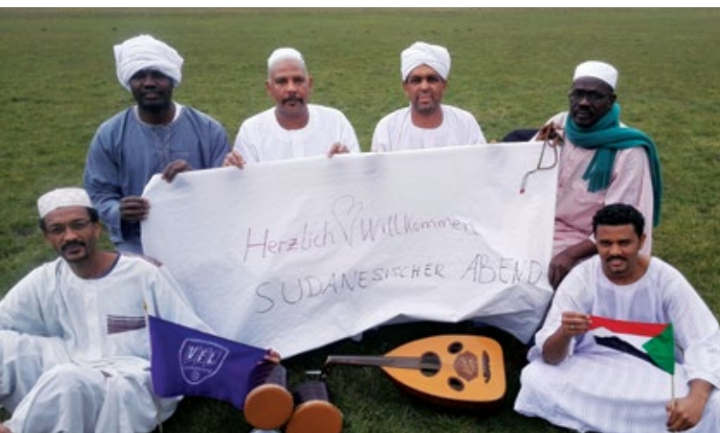
„Sudan-Abend“ im Rahmen des „Afrika Festivals Osnabrück“ 2016.

Das Büro für Friedenskultur versteht sich in diesem Prozess als Koordinierungsstelle, die den Abstimmungsprozess unterstützt. Eine enge stadtinterne Kooperation zu den ebenfalls mit Querschnittsaufgaben beauftragten Fachdiensten wie zum Beispiel den Büros der Integrationsbeauftragten, der Gleichstellungsbeauftragten, dem für Städtepartnerschaften und der Strategischen Stadtentwicklung stärkt diesen Prozess und lässt für die Zukunft ein abgestimmtes Bildungs- und Projektangebot im Rahmen der kommunalen Entwicklungszusammenarbeit erwarten.