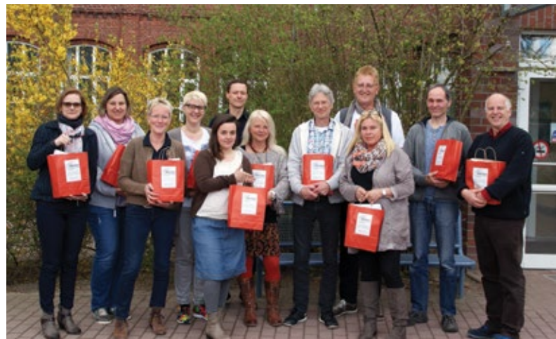
Leiterinnen und Leiter der Emder Grundschulen erhalten „Fairtrade-Probiersets“.

Ja, die jährliche Teilnahme an der „Fairen Woche“ hat sich bereits etabliert und wird mit einem breit gefächerten Programm zelebriert. So gab es in Emden in den Jahren 2015 und 2016 beispielsweise faire und regionale Frühstücke und Mittagstische, verschiedene Produktverkostungen, die Einführung von Eisbechern mit fairen Zutaten in Emder Eisdielen und Gottesdienste, die sich dem Thema widmeten. Als größere Veranstaltungen gab es einen Produzentenbesuch aus Ecuador an der „Fairtrade-Grundschule“ Cirksena sowie zwei Theateraufführungen für die Schülerinnen und Schüler in Emden. Im Jahr 2015 wurde ein Theaterstück über Globales Lernen mit dem Titel „Zum Glück stolpern“ aufgeführt. Im Jahr 2016 konnte die Theatergruppe PREDA/Akbay von den Philippinen ihr selbst verfasstes Musicaldrama in deutscher Sprache aufführen.