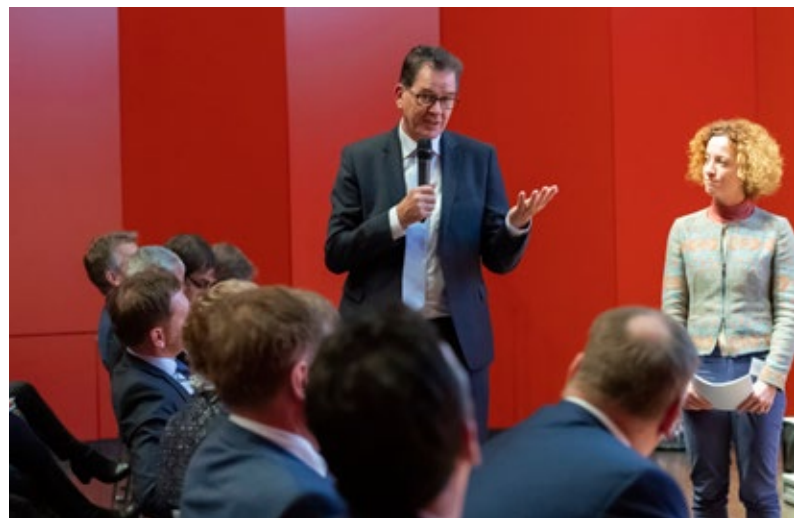
Bundesentwicklungsminister Dr. Müller beantwortet eine Frage aus dem Publikum