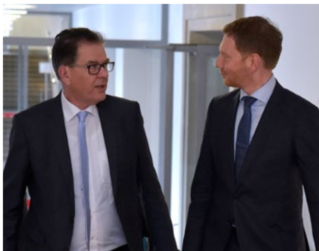
Ministerpräsident Kretschmer begrüßt Bundesentwicklungsminister Dr. Müller