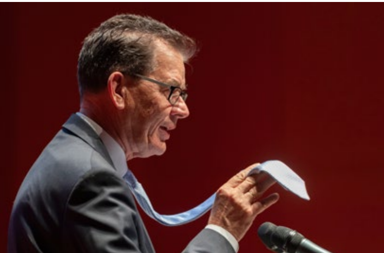
„Den Preis von unserem ‚billig‘ zahlen oft andere!“ Bundesentwicklungsminister Dr. Müller warb in seiner Rede für faire Kleidung vom Schlips bis zur Sohle.

Bund und Freistaat schaffen für Sie die Rahmenbedingungen, initiieren Netzwerke. Ich baue in diesem Zusammenhang auch auf die Unterstüt-