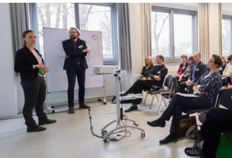
Willkommen zu Forum 3!