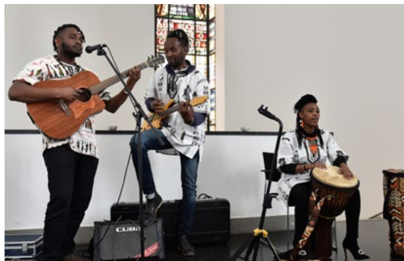
Musikalischer Rahmen: Bei der multinationalen Chemnitzer Band Sawa Sawa ist der Name Programm. Auf Swahili bedeutet „sawa sawa“ so viel wie „alles gut, don't worry“ – eine Haltung, die auch kommunale Partnerschaften positiv zu prägen vermag.