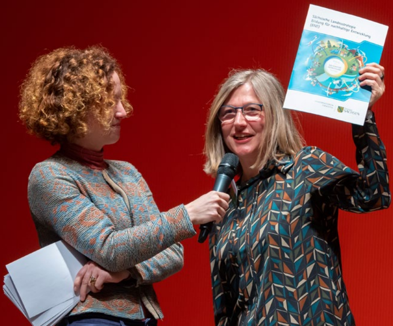
Die „Sächsische Landesstrategie Bildung für nachhaltige Entwicklung“ kann zum Schlüssel für Kommunen werden, die Nachhaltigkeits- und Entwicklungspolitik stärker in ihr Handeln integrieren wollen, so ein Ergebnis der Konferenz (Informationsforum 3)