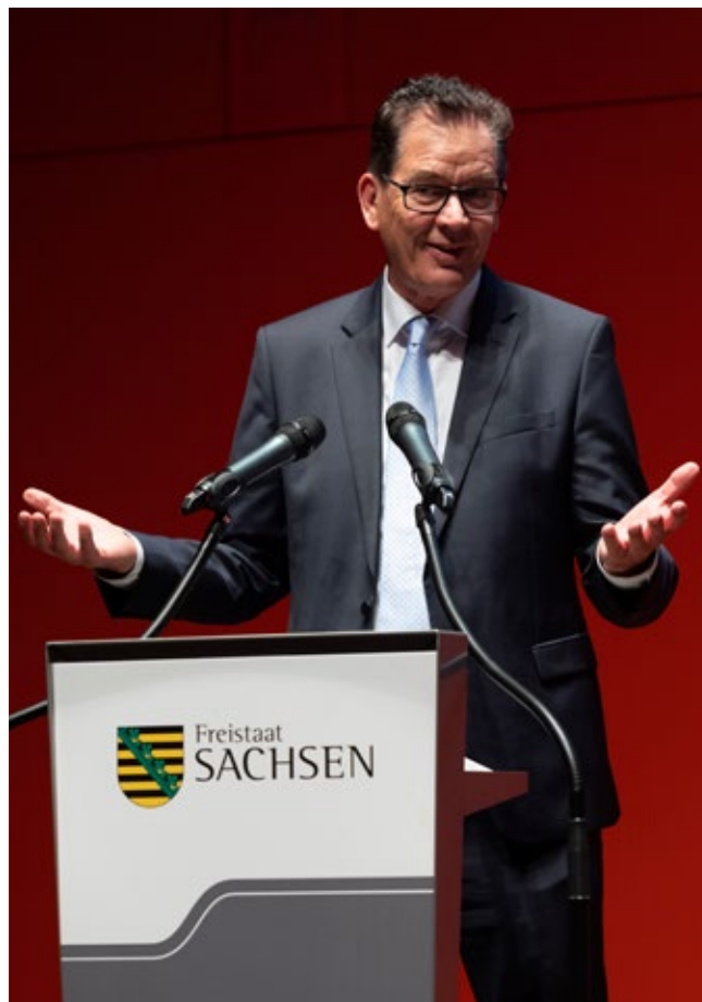
Bundesentwicklungsminister Dr. Gerd Müller

Drei Monate ohne Regen: So etwas wird auch in Sachsen häufiger werden. Aber auf meinen Reisen erzählen mir die Menschen: Drei Jahre ohne Regen im Sahel, so etwas hat es seit Menschengedenken nicht gegeben. Erst sterben die Pflanzen, dann die Tiere, dann der Mensch.