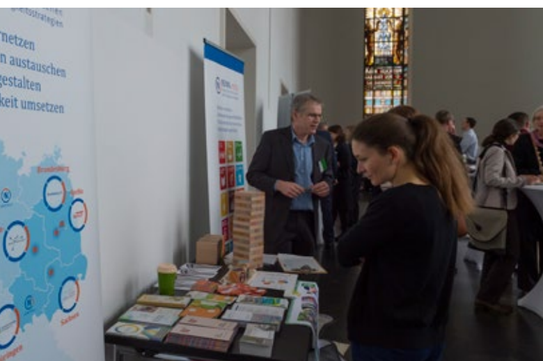
RENN.mitte auf dem „Markt der Möglichkeiten“

www.renn-netzwerk.de/mitte/ueber-uns/sachsen