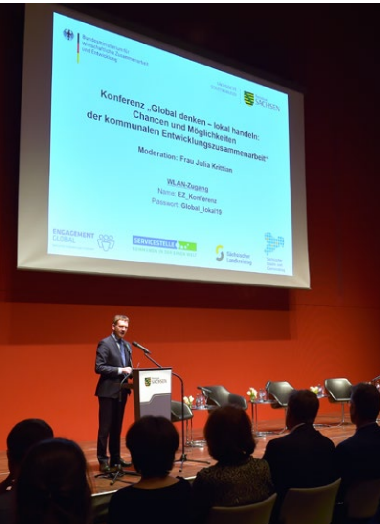
Ministerpräsident Kretschmer begrüßt die Teilnehmenden