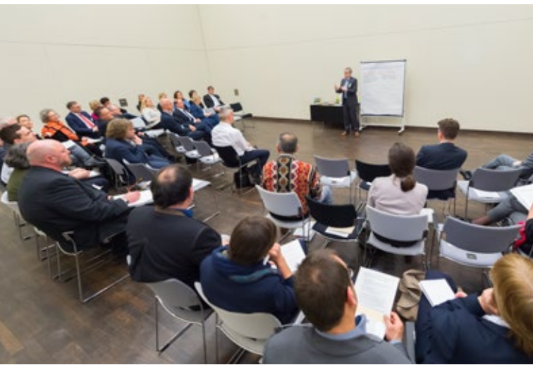
Denkanstöße in Forum 5

Zahlreiche in Forum 5 vertretene Kommunen bekundeten ihr Interesse, an einem neuen „Sächsischen Bürgermeisterdialog“ mitzuwirken. Schon für 2019 wird nun der Start vorbereitet.