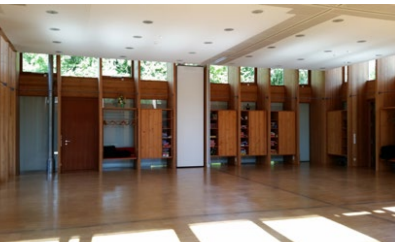
160 m 2 großer multifunktionaler Saal im städtischen Jürgen Rickertsen Haus.

Über eine gemeinsame Verständigung zum Armutsbericht zwischen Politik und Verwaltung sollen konkrete Planungen und Maßnahmen für die Verbesserung der Armutssituation in Reinbek angestoßen werden. Zudem strebt die Stadt ein jährliches Sozialmonitoring und eine fortlaufende Berichterstattung dazu an. Hierzu werden zentrale Indikatoren für Reinbek im nächsten Schritt zu identifizieren sein. Als Orientierung dienen die Indikatoren der UN-Nachhaltigkeitsziele. Zudem wird das Klimakonzept konsequent weiterentwickelt.