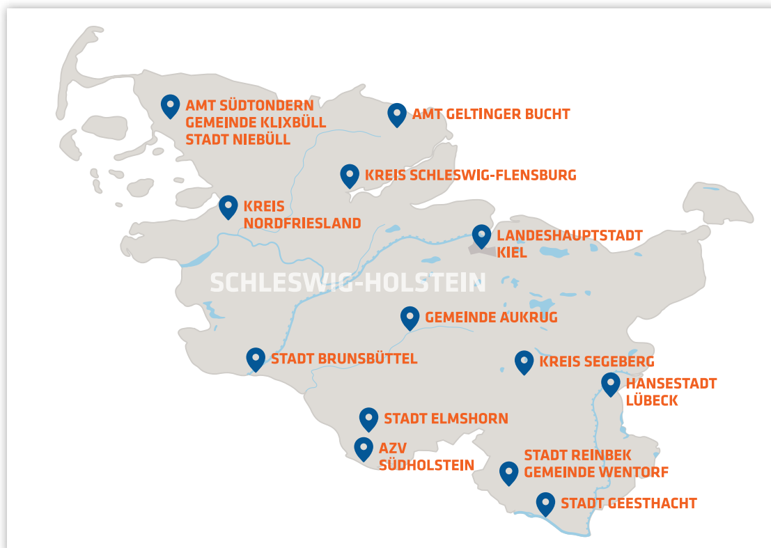
Abb. 2: An Global Nachhaltiger Kommune Schleswig-Holstein beteiligte Kommunen

In den Jahren 2015/2016 haben wir als Kommune begonnen, uns mit Nachhaltigkeitsfragen zu beschäftigen, darunter mit dem Thema Plastikmüll oder der Auszeichnung als Fairtrade-Town. In diesem Zeitraum wurde