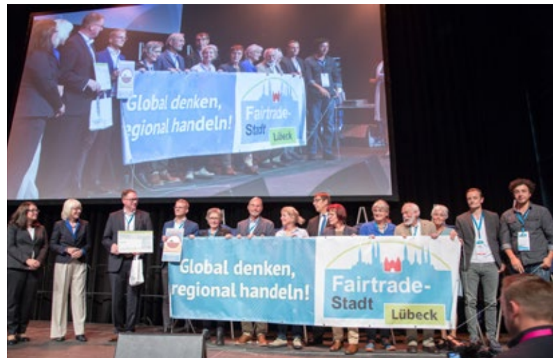
Preisverleihung Hauptstadt des Fairen Handels

Generell wäre es natürlich sehr erstrebenswert, möglichst viele der 17 Ziele der Agenda 2030 umzusetzen. Und da gibt es nicht nur in Lübeck, sondern auch auf nationaler und internationaler Ebene noch sehr viel zu tun. Dabei greifen die Themen wie die Zahnräder eines Uhrwerks häufig ineinander, und eine positive Veränderung bedingt weitere an anderer Stelle. Wenn wir es schaffen, die Einhaltung der Nachhaltigkeitsziele in den Köpfen der Menschen zu verankern, dann wird dies nicht nur den kommenden Generationen, sondern vor allem unserer Lebensgrundlage auf dem Planeten Erde zugutekommen. Hier ist nicht nur die Verwaltung, sondern Jeder und Jede gefragt, im Sinne der Nachhaltigkeit zu handeln und daran zu wachsen. Und dies geht nur im friedlichen Miteinander, ohne Angst und Fremdenhass.