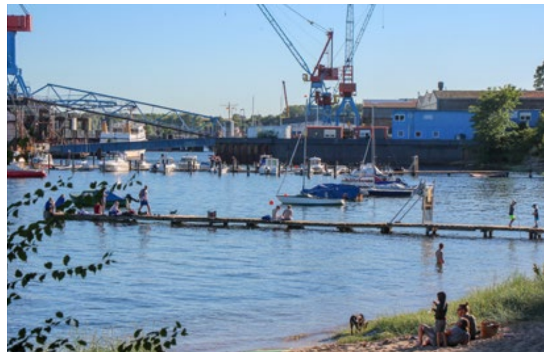
Der Strand in Friedrichsort, Kiel

Kiel ist die Landeshauptstadt von Schleswig-Holstein. Mit 247.548 Einwohnerinnen und Einwohnern ist sie die nördlichste Großstadt Deutschlands und bildet das Zentrum der Kiel-Region. Die Stadt liegt an der Ostsee (Kieler Förde) und ist Endpunkt der meistbefahrenen künstlichen Wasserstraße der Welt, des Nord-Ostsee-Kanals. Die Stadt Kiel nahm 2017/2018 am ersten Durchlauf der Workshopreihe teil.