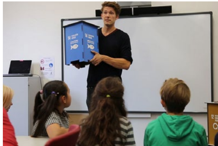
SDG-Workshop für Kieler Schülerinnen und Schüler

Zusätzlich sollten kommunale Akteurinnen und Akteure das Thema auf verschiedensten Kanälen auch nach außen tragen, um die Öffentlichkeit zu erreichen und über den aktuellen Stand zu informieren. Hierzu gehört, dass man über die Aktivitäten der Kommune transparent informiert und sie mit konkreten Zielen in Verbindung bringt. Toll ist, wenn man mit den verschiedenen Fachbereichen zusammenarbeitet und so ein diverses Bild der Verwaltung wiedergeben kann.