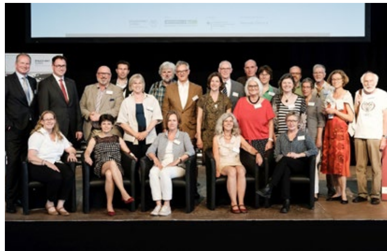
Bundeskonferenz in der Hansestadt Lübeck

2017/2018 habe ich an der dreiteiligen Workshopreihe der SKEW teilgenommen. Parallel hierzu wurde die Bestandsaufnahme durchgeführt. Diese stellte für die Stadt eine Art Initialzündung dar, um das Thema zu aktivieren und mögliche Projekte anzustoßen. Aber vor allem war die Bestandsaufnahme auch wichtig, um zu sehen, was wir in den diversen Bereichen schon auf den Weg gebracht haben. In diesem Prozess haben wir deutlich gespürt, dass den Mitarbeitenden Nachhaltigkeitsthemen wichtig sind.