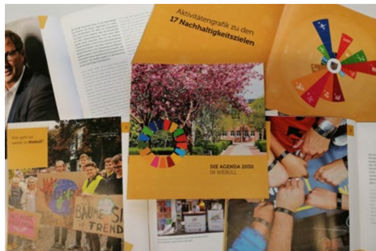
SDG-Broschüre Niebüll, erschienen 2019

Nicht zuletzt konnten wir mithilfe der SKEW eine Broschüre erstellen, die einen Überblick über die bisherigen Aktivitäten der Stadt zur Umsetzung der Agenda 2030 gibt.