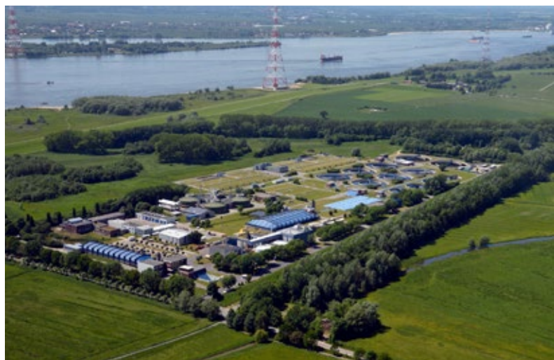
Luftbild des Klärwerks Hetlingen

Wir haben über den Schleswig-Holsteinischen Gemeindetag [SHGT, Anm. d. Redaktion] von dem Projekt erfahren. Die Entscheidung für die Teilnahme ist dann schnell gefallen. Nachhaltigkeit ist beim AZV Südholstein kein Fremdwort, sondern seit Langem ein Bestandteil unseres Leitbilds.