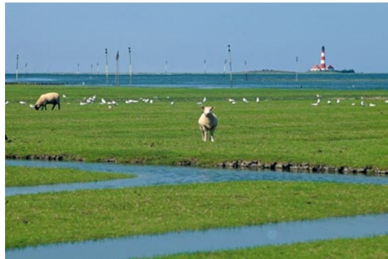
Leuchtturm mit Schafen in Nordfriesland