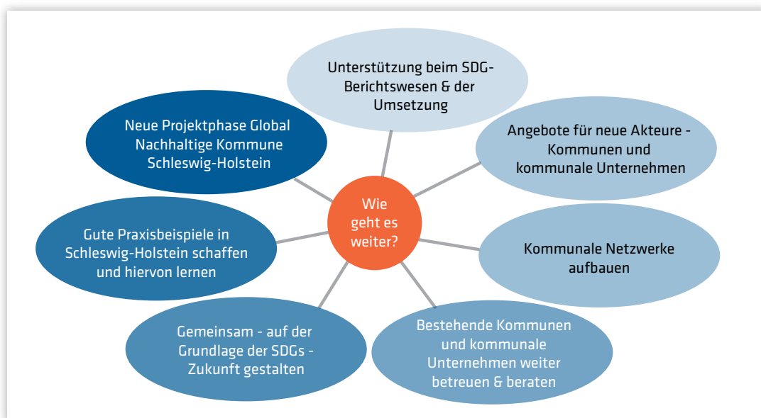
Abb. 3: Zukünftige Angebote und Leistungen für schleswig-holsteinische Kommunen

Kommunale Netzwerke aufbauen – In dem Agenda-2030-Prozess kommen unweigerlich Fragen, Unklarheiten und Herausforderungen auf – einige davon wurden schon anderswo „gelöst“. Deshalb werden 2021 und 2022 eine Reihe von Netzwerkveranstaltungen angeboten, die den kollegialen Austausch der SDG-Kommunen befördern sollen. Hier wird darauf geachtet, dass sowohl der fachliche