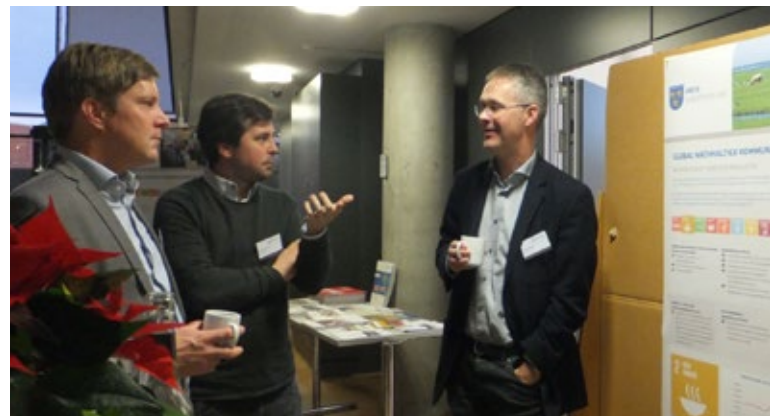
Teilnehmende vor der Posterausstellung bei der Abschlusskonferenz „Global Nachhaltige Kommune“