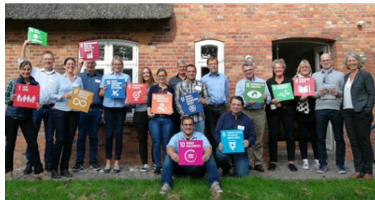
Gruppenfoto des dritten Workshops