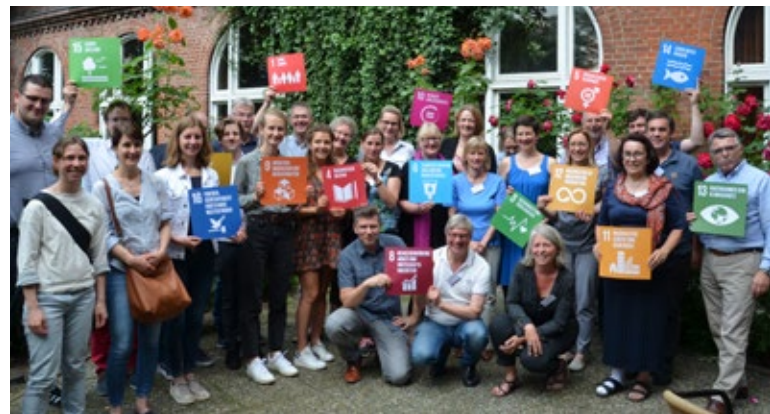
Gruppenfoto des zweiten Workshops

Im Dezember 2019 lud die SKEW die an den Projektrunden beteiligten kommunalen Akteurinnen und Akteure zu einer abschließenden Konferenz ein. Der Einladung folgten 20 Vertreterinnen und Vertreter aus der kommunalen Verwaltung, der Politik und den kommunalen Verbänden. Im Mittelpunkt des gemeinsamen Tages stand insbesondere der Erfahrungsaustausch untereinander.