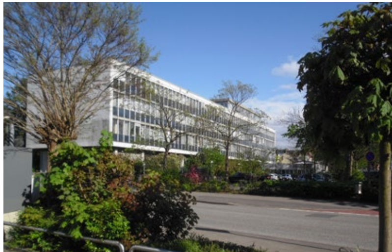
Das Rathaus der Stadt Elmshorn

Schon bevor wir an dem Projekt „Global Nachhaltige Kommune Schleswig-Holstein“ teilgenommen haben, haben wir uns als Stadt mit der Umsetzung diverser Themen beschäftigt, u. a. Klimaschutzprojekte, diverse Stadtentwicklungs-Projekte oder auch die Zertifizierung als Fairtrade-Town. Als der Aufruf über das Land kam, an dem Projekt und der Workshopreihe teilzunehmen, habe ich nach Rücksprache mit dem Bürgermeister zugesagt. Als Stadt war es gut zu wissen, dass man sich erst einmal zu nichts verpflichten musste.