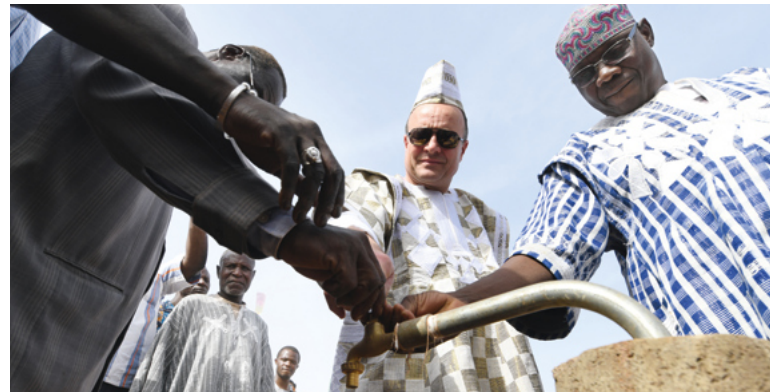
Delegationsreise Förderkreis Burkina Faso/Stadt Ludwigsburg im Januar 2018 nach Kongoussi

Der Klimawandel ist im und um den Bamsee bereits spürbar. „In der Region nehmen Dürren zu und es regnet seltener, dafür aber extremer. Folgen große Niederschläge auf lange Trockenphasen, wird fruchtbarer Boden weggeschwemmt“,