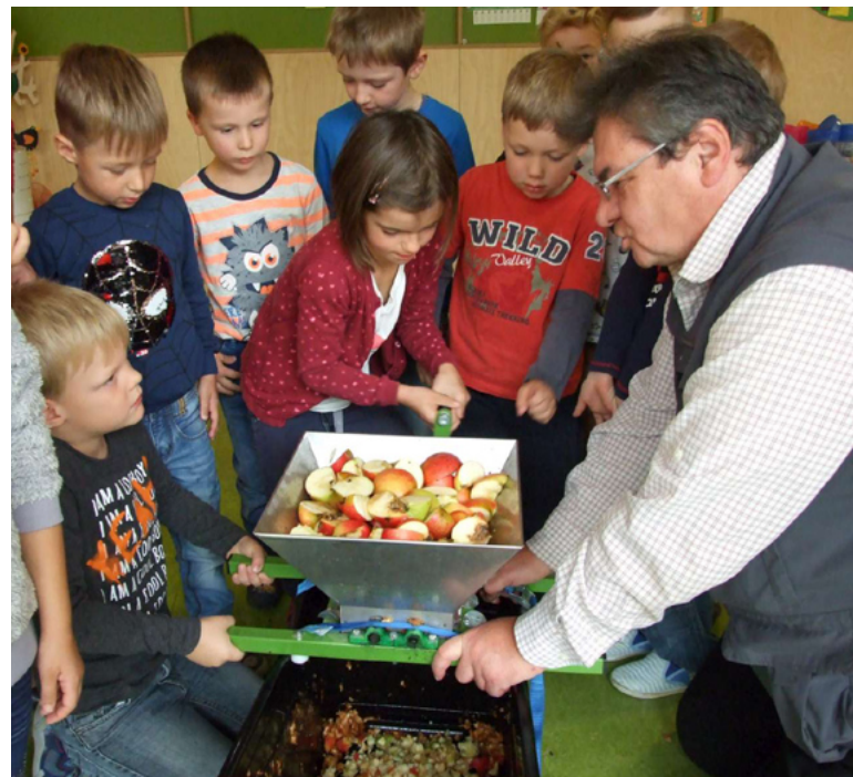
Beim Obstpresstag in der Kita lernen die Kleinen in Nebelschütz, wie gut Apfelsaft von Streuobstwiesen schmeckt.

Eine Streuobstwiese etwa rechnet sich über die Jahre und ist – auch dank des Verzichts auf Pestizide – eine der besten Voraussetzungen für Artenvielfalt: „Man kann das Obst verwenden und auch Heu vom Boden nutzen“, zählt der Bürgermeister auf. Nicht nur ideell, sondern tatsächlich auch finanziell trägt sich das Nebelschützer Konzept. So können