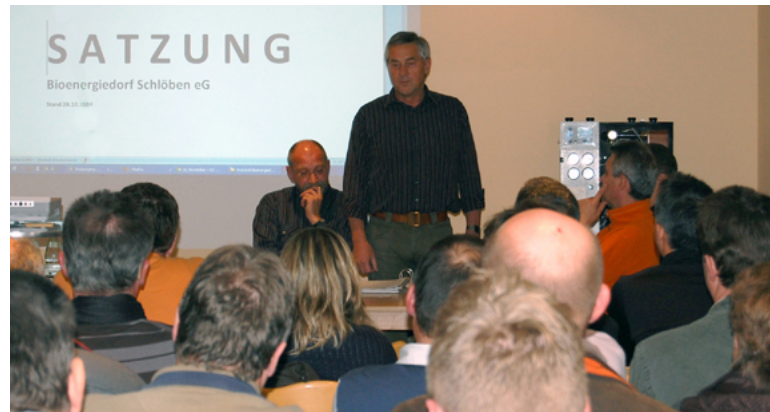
Überzeugungsarbeit: Alle auf dem Weg zum Bioenergieort mitnehmen

2012 sind 187 Haushalte an das neue Nahwärmenetz angeschlossen – zwei Ortsteile von Schlöben. Und wo die Erde schon mal aufgegraben wurde, hat Schlöben auch moderne Glasfaserkabel verlegt. Die Finanzierung dafür kam aus einem Wettbewerb des Bundeswirtschaftsministeriums zum Thema Breitbandinternet, den die Gemeinde gewonnen hat.