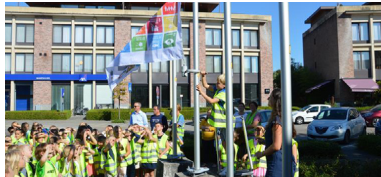
Gemeinsam die SDG-Flagge hissen und für Aufmerksamkeit sorgen

Der Aufruf zur „Woche der nachhaltigen Gemeinde“ richtete sich an alle flämischen Kommunen. Um teilzunehmen, mussten sie zweierlei tun: Sie hissten für die ganze Woche die SDG-Flagge an ihren Rathäusern. Und sie ernannten „lokale Helden der Nachhaltigkeit“, maximal 17 pro Kommune. Die VVSG stattete die Kommunen unter anderem mit Stickern mit dem Aufdruck „Held der Nachhaltigkeit“ aus. Sie unterstützte außerdem dabei, die mediale Aufmerksamkeit zu wecken. „Es gab großes Interesse der lokalen Medien an der Kampagne“, sagt Heleen Voeten von der VVSG. 80 flämische Kommunen