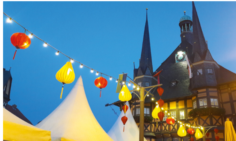
Mit einem dreitägigen Lampionfest machte Wernigerode die Klimapartnerschaft mit Hoi An im August 2019 sichtbar.

Hoi An als Küstenstadt ist häufig von Hochwasser, Taifunen und weiteren Folgen des Klimawandels betroffen, auch in Wernigerode macht sich der Klimawandel durch Extremwetterereignisse bemerkbar. Beide Städte sind zudem engagiert im Klimaschutz. Im Rahmen ihrer Partnerschaft haben sie ein gemeinsames Handlungsprogramm zu Klimaschutz und Klimafolgenanpassung erarbeitet. So wurde die Partnerschaft Teil des Netzwerkes der Kommunalen Klimapartnerschaften, welches von der „Servicestelle Kommunen in der Einen Welt“ (SKEW) und der Landesarbeitsgemeinschaft Agenda 21 NRW e.V. begleitet wird. Ihren bisherigen Höhepunkt erreichte die Klimapartnerschaft mit der Errichtung einer Photovoltaikanlage zur Versorgung der Altstadt und des Tourismuszentrums von Hoi An.