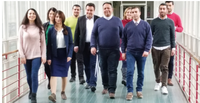
Acht Geflüchtete lernen in Krefeld, wie eine deutsche Verwaltung funktioniert.