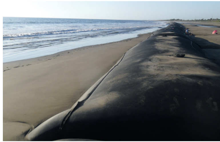
Riesige, mit Sand gefüllte Schläuche (Geotuben) schützen die Küsten vor Corinto.

Begonnen wurde die Klimapartnerschaft mit dem Küstenschutz, da in diesem Bereich die größte Gefahr für die Stadt bestand. Der Vorschlag aus Corinto für das erste Projekt waren Geotuben – riesige, mit Sand gefüllte Schläuche, die am Strand verlegt werden und eine weitere Erosion der Küste verhindern. Im Rahmen der Klimapartnerschaft wurde das Projekt von der SKEW mit über 550.000 Euro gefördert – bei Gesamtkosten von knapp 630.000 Euro. Mehrere Kilometer Strand werden seitdem von den Schläuchen geschützt, mit großem Erfolg: Die Küstenerosion ging zurück, heute werden täglich wieder rund 150 Kubikmeter Küste angeschwemmt. Das Projekt hat Modellcharakter bekommen: Inzwischen hat auch die Nationalregierung 1 Million US-Dollar bereitstellt, um weitere Gebiete rund um Corinto zu sichern. Auch andere Staaten in Lateinamerika interessieren sich für die Maßnahme.