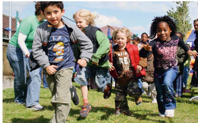
Bewegung ist neben gesundem Essen und gutem Schlaf zentral für die Gesundheit.