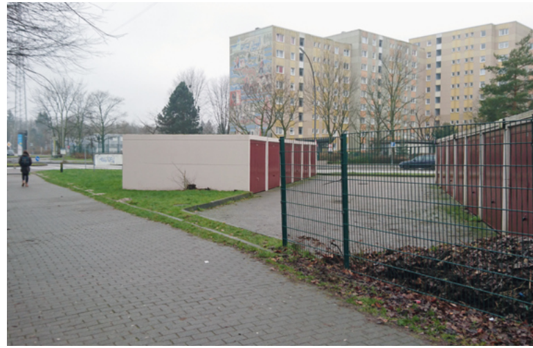
Rund 7.000 Menschen leben im Quartier Bergedorf-West.

„Hamburg soll als gerechte und lebenswerte Stadt weiterentwickelt und der soziale Zusammenhalt gefördert werden. Mit dem Rahmenprogramm Integrierte Stadtentwicklung wollen wir Quartiere mit besonderem Entwicklungsbedarf städtebaulich und sozial stabilisieren“, erklärt Dr. Dorothee Stapelfeldt, die Hamburger Senatorin für Stadtentwicklung und Wohnen die Zielsetzung des Rahmenprogramms. Die Lebensqualität wird durch Investitionen in die Bildungsinfrastruktur und die soziale Infrastruktur, in das Wohnumfeld und die Versorgungsstrukturen verbessert.