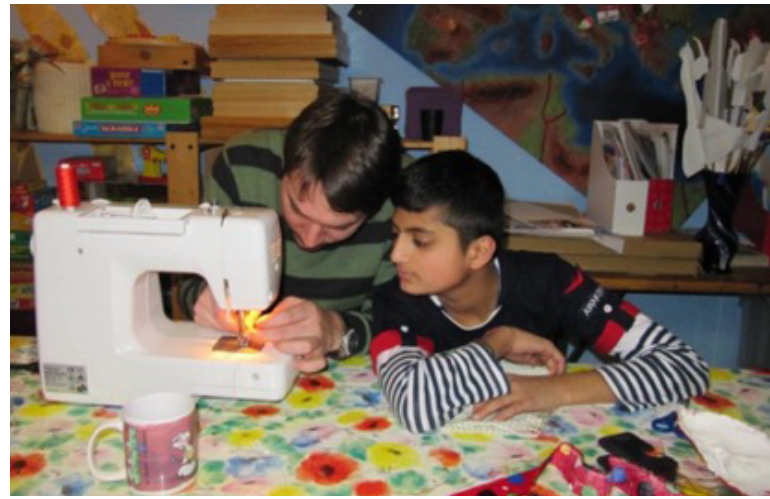
Aktion der Jugendarbeit: Koch- & Handarbeitsaktionen für Jungs

Auch auf Bezirksebene fand der Ansatz Anwendung und ist in Wien-Meidling seit 2005 etabliert. „Es ist am Anfang natürlich mit ein bisschen Mehraufwand verbunden, weil