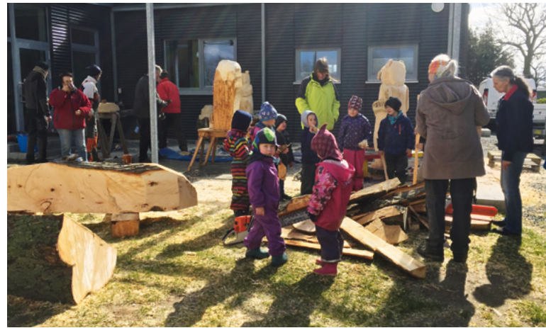
Nachmittags wird der Campus zum Dorfplatz, auf dem vielfältige Kurse und Veranstaltungen stattfinden.

Um dem gerecht zu werden, wurde 2016 der sogenannte Dörpscampus fertiggestellt – ein Multifunktionsgebäude, das die Schule im Hinblick auf den offenen Ganztagsbetrieb braucht: Es bietet eine Mensa für Schule und Kindergarten sowie einen Musikraum, beide können gleichzeitig als Veranstaltungsräume genutzt werden. Und nach dem Schul- und Kindergartenbetrieb wird der Dörpscampus zum „Dorfplatz“. Vereine und Initiativen können ihn für Veranstaltungen nutzen, es gibt klimafreundliche Kochkurse, Vorträge, Konzerte oder ein Repaircafé.