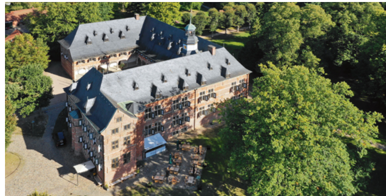
Das Schloss Reinbek ist das älteste Gebäude und Wahrzeichen der Stadt Reinbek.

Mithilfe einer quantitativen und qualitativen Bestandsaufnahme entlang der SDGs wurde eine Grundlage zur Erstellung des Berichts geschaffen. Wie bei den SDGs legte auch der Reinbeker Armutsbericht Wert auf die Prämisse „Leave no one behind“. So wurde der Bericht neben lokalen Themen auch der globalen Verantwortung Reinbecks gerecht und stellt Informationen und Empfehlungen zum Thema Partnerschaften und faire Beschaffung zusammen. Für die quantitative Erhebung nutzt die Stadt statistische Daten aus dem „Wegweiser Kommune“ der Bertelsmann Stiftung, den Landes- und Statistikämtern und der Reinbeker Verwaltung. Für die qualitative Erhebung griff man auf Dokumente, Unterlagen sowie die Zuarbeit der Verwaltung und der Stakeholder in Reinbek zurück und fragte konkret, was Reinbek zur Verringerung der Armutssituation bzw. des Armutsriskos in einem sektorübergreifenden Ansatz beiträgt. Dem SDG 10 kam im Bericht eine Querschnittsfunktion zuteil und wurde insbesondere zusammen mit SDG 5 Gleichstellung thematisiert. So wird u.a. empfohlen, die Frage nach „Frauen in Führungspositionen“ in der Verwaltung stärker zu thematisieren, aber auch Themen der Kinderbetreuung bei der Übernahme von ehrenamtlichen Tätigkeiten. Die SKEW unterstützte im Rahmen des Projekts GNK Schleswig-Holstein mit der Moderation der Workshops, die Durchführung der Bestandsaufnahme sowie durch inhaltliche Begleitung bei der Berichterstellung.