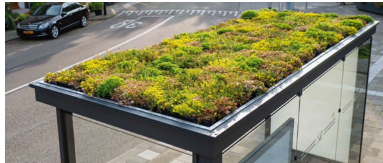
Auch Bushaltestellen liefern in Utrecht einen Beitrag zu sauberer Luft.

Einkommen, Bildungsgrad und Wohnort wirken sich auf die Gesundheit aus. Utrecht will die Unterschiede ausgleichen und fokussiert sich deshalb auch auf benachteiligte Stadtteile. Eine gesündere Ernährung, mehr Bewegung und eine bessere Luftqualität sollen überall Realität werden. Eine der Maßnahmen ist das Fördern des Radfahrens. Utrecht ist inzwischen auf Platz zwei der radfreundlichsten Städte Europas, direkt hinter Kopenhagen. Und strebt den ersten Platz an. Die Stadt will es den Menschen so einfach wie möglich machen, aufs Fahrrad umzusteigen – das reduziert den CO 2 -Ausstoß und sorgt für mehr Bewegung im Alltag.