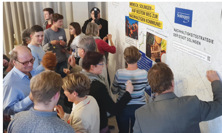
Nachhaltigkeitskonferenz: Bürgerinnen und Bürger erarbeiten die Strategie der Stadt Solingen mit.

Am Anfang stand eine Bestandsaufnahme: Wie ist die Stadt in Sachen Nachhaltigkeit bisher aufgestellt? Gefolgt von der Frage nach dem Ziel: Worauf wollen wir uns beim Thema Nachhaltige Entwicklung konzentrieren? Dabei wurden sechs vorrangige Themenfelder ausgemacht: Gesellschaftliche Teilhabe, natürliche Ressourcen und Umwelt, Klima und Energie, Mobilität, Arbeit und Wirtschaft sowie Globale Verantwortung und kommunale Entwicklungspolitik. Über die Themenfelder wird auch ein direkter Bezug zu fast allen 17 SDGs der Vereinten Nationen hergestellt. Und gemeinsam mit ihren Bürgerinnen und Bürgern hat die Stadt geklärt, wie sie sich in Zukunft in diesen Themenfeldern ausrichten will. Auf