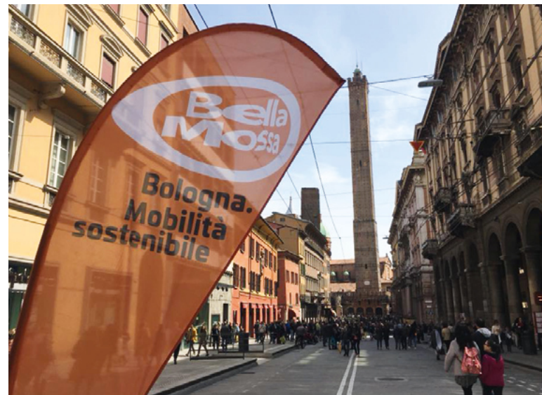
Aufs Auto verzichten – die Handy-App „Bella Mossa“ schafft Anreize.

Besonders erfolgreich wurde „Bella Mossa“ von teilnehmenden Firmen genutzt. Da über 40 Prozent der Einwohnerinnen und Einwohner Bolognas ihr Auto für den Arbeitsweg