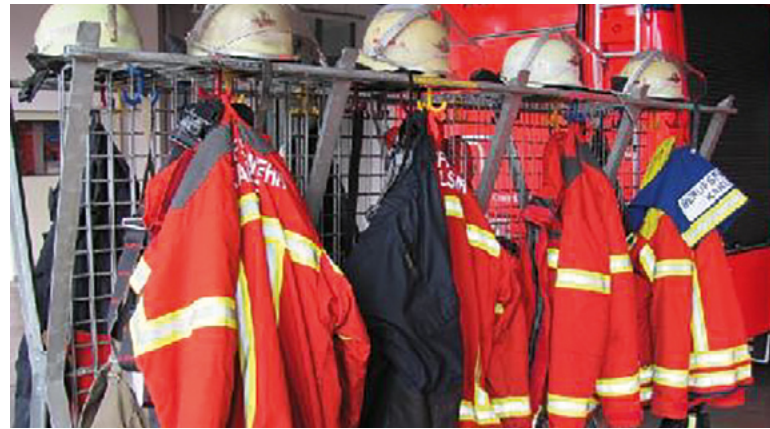
Schutzbekleidung der Branddirektion